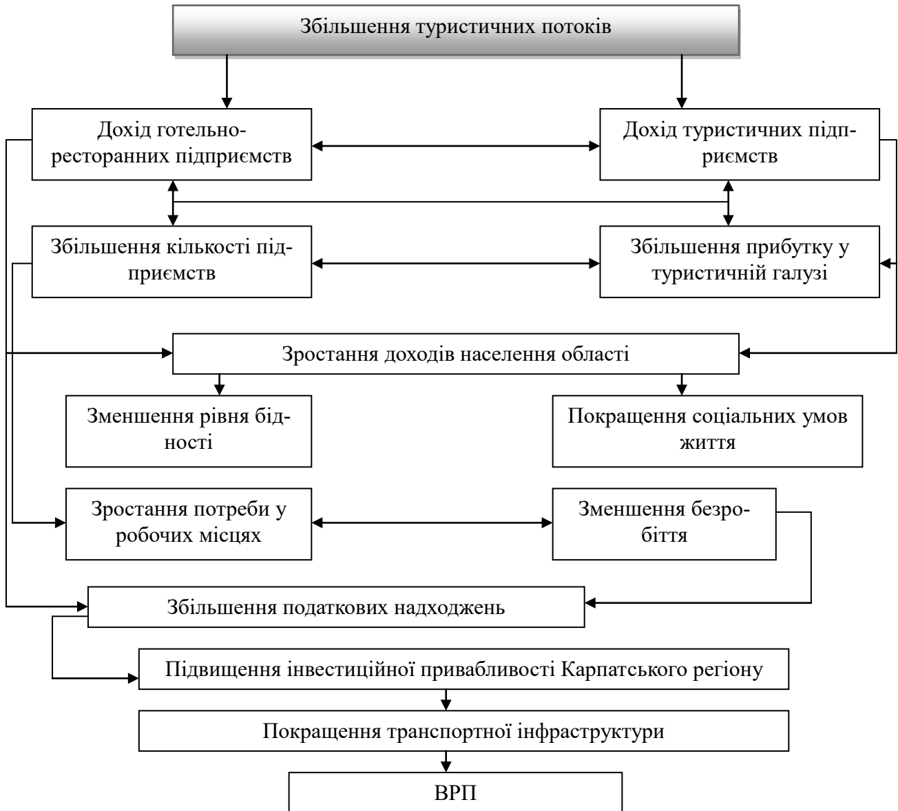
Рис. 2. Модель впливу туризму на соціально-економічний розвиток Карпатського регіону (власна розробка автора)

рмується на основі таких елементів, як збільшення туристичних потоків, збільшення доходів готельно-ресторанних підприємств та туристичних підприємств, зростання доходів населення, зменшення рівня бідності та покращення соціальних умов життя, зростання потреби у робочій силі та зменшення безробіття, що у свою чергу призведе до збільшення податкових надходжень, підвищення інвестиційної привабливості області, покращення транспортної інфраструктури та зростання ВРП (див рис. 2).