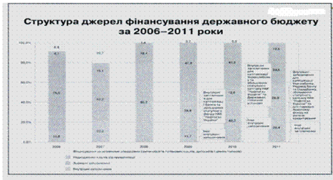
Рис. 2 Структура джерел фінансування державного бюджету за 2006–2011 роки

У цілому структура джерел фінансування протягом 2006–2011 років не відображає сталої тенденції. І хоча упродовж останніх років вона досить схожа, у 2011 році збільшилась частка надходжень від приватизації, що пов'язано з продажем «Укртелекому», та значно зменшилась та значно зменшилася частка зовнішніх запозичень (рис. 2).