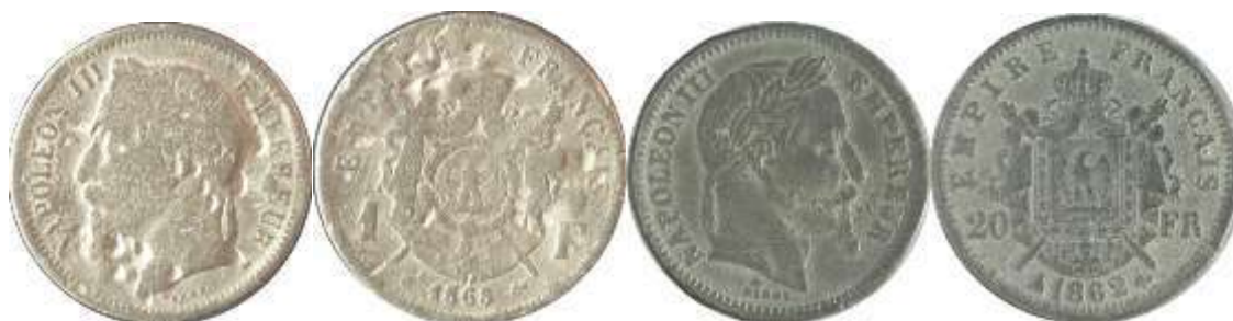
Рис. 2. Тогочасні підробки французьких монет 1860-х рр. зі знахідок Словаччини.