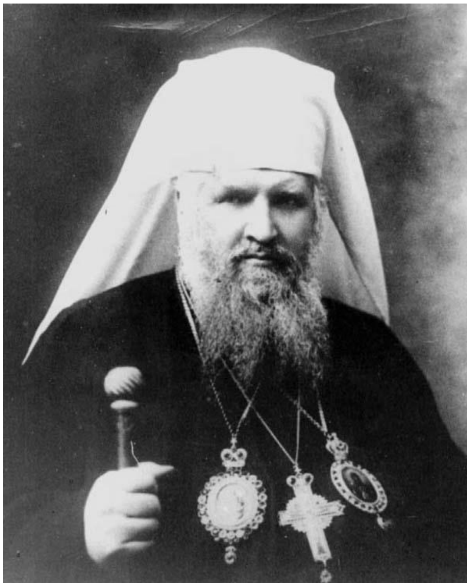
Митрополит Андрей Шептицький

В. Гренджа-Донський занотовує у щоденнику: «Берегово вже два тижні евакує. Знаємо певно, що лінія Чоп – Берегово – Вилोक відпаде, бо це ж чиста малярська околиця. Маляри просять більше, але чей же не можуть вимагати наших сіл?! Либонь не позбавлять нас залізничної лінії?»