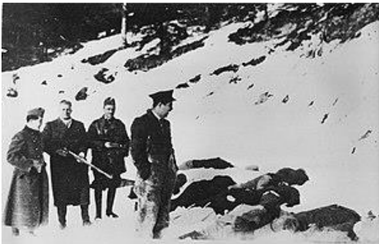
Розстріли на Верецькому перевалі

Польські власті розстріляли переданих їм напередодні січовиків-галичан у смузі обабіч новоутвореного угорсько-польського кордону.