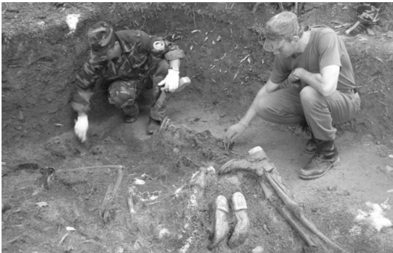
Розкопки на Верецькому перевалі. Наші дні

«У Буштині нас зустріли вогнем, але інцидент швидко опановано. Там ми довідалися, що дорога на Тячів замкнена, бо обсадили її місцеві мадяри. Тому колону скеровано на Терембю – Нересницю – Апшу – Бичків. Завдяки ночі і перерізанню телеграфічних стовпів встигли ми перебитися окружною дорогою до Тиси. Румунську дорогу перейшли неспостережені пониже Бичкова 18 березня о 3 годині ранку. Близько 10 години румуни нас всіх віддали мадярам – разом 273 особи, з них 6 старшин. З тим моментом почалася наша мартирологія в мадярській неволі» (О. Волянський).