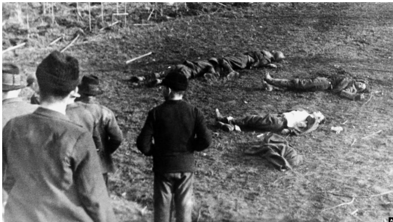
Хуст, 16 березня 1939 року

держаться ще тільки обидва скоростріли при мостах. Рівночасно дістали ми скорострільний вогонь з-за Тиси» (О. Волянський).