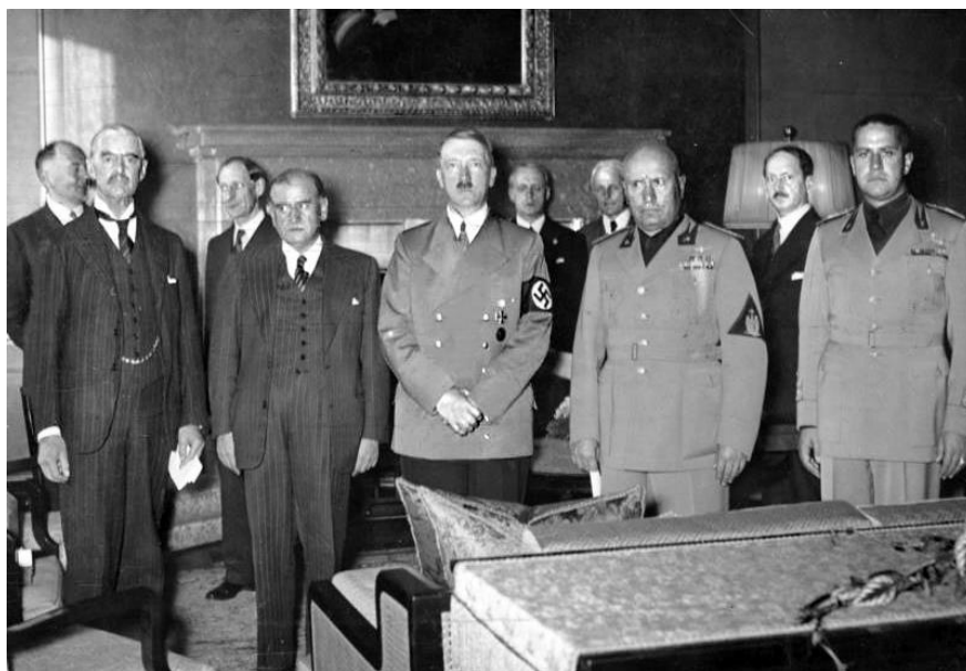
Учасники Мюнхенської конференції, яка заклала основи для державного розпаду Чехословаччини

Мюнхенська конференція за участю глав урядів Великобританії, Франції, Німеччини та Італії. Останніх вдалося умовити на участь у конференції за посередництва президента США Ф. Рузвельта. Конференція вирішила, аби ЧСР погодилася на плебісцит у спірній Судетській області. Це поклало початок розчленуванню ЧСР.