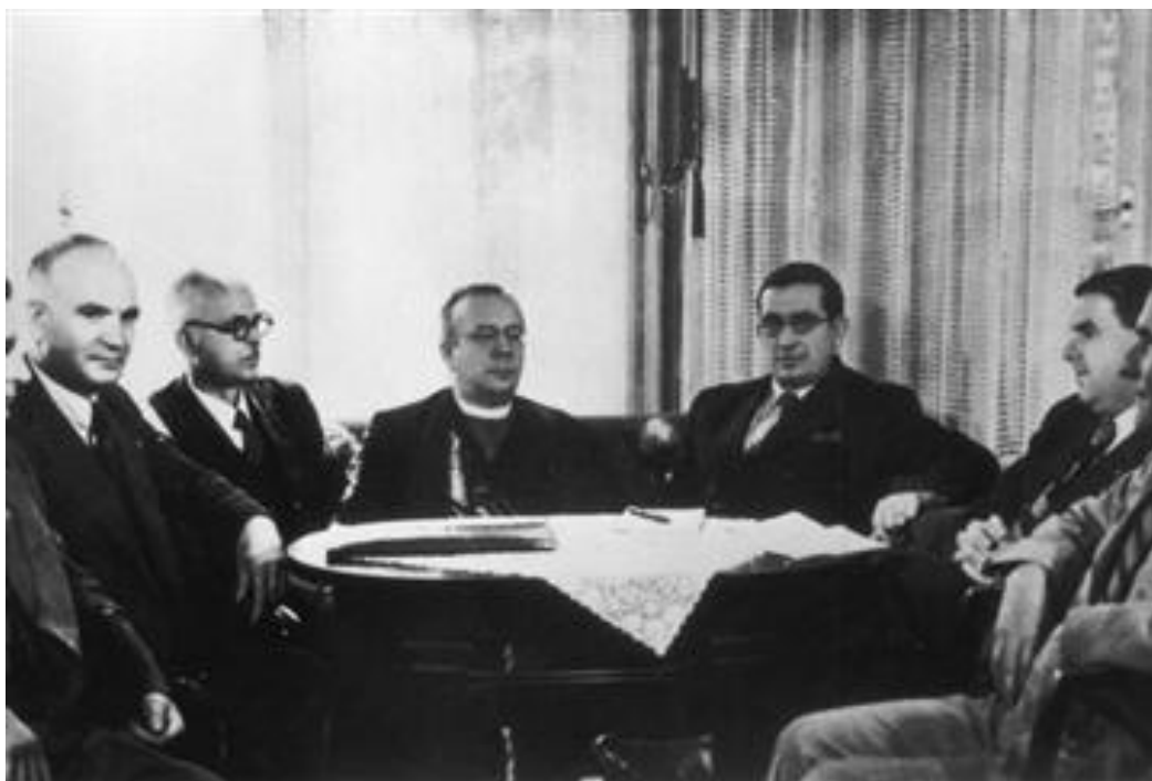
Засідання уряду Августина Волошина

О 16. 40 А. Волошин у приміщенні канцелярії міністра внутрішніх справ Підкарпатської Русі Е. Бачинського по телефону склав українською мовою присягу голови Ради міністрів Підкарпатської Русі, яку у Празі прийняв прем'єр Я. Сирови. Свідками церемонії були дивізійний генерал Ігор Сватек і віце-губернатор краю О. Бескид. Тепер автономна Рада міністрів складалася з А. Волошина, Ю. Ревая і Е. Бачинського. С. Фенцик виїхав до Угорщини.