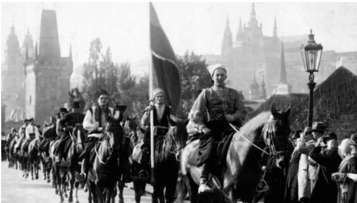
Марш карпатських січовиків

Статут ОНОКС затверджено Ю. Реваєм. Циркулярним листом міністр закликав місцеві органи влади співпрацювати з січовиками.