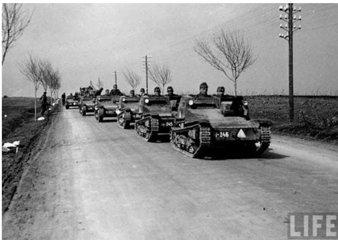
Угорське вторгнення в Карпатську Україну

О 17.30 Л. Прхала оголосив наказ про «евакуацію чеських військових частин і державних службовців з Підкарпатської Русі».