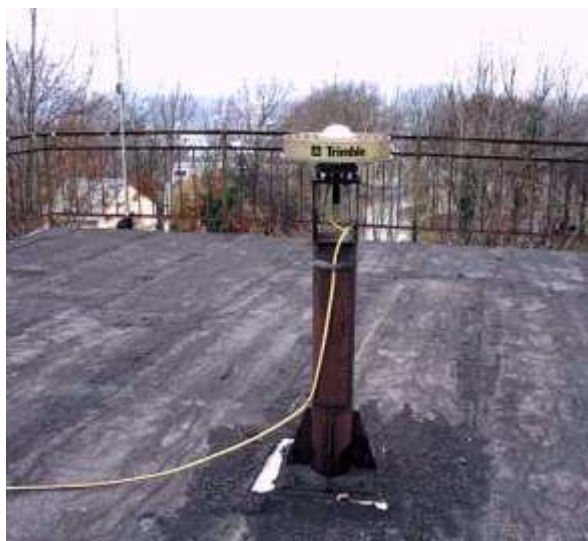
Рис.6. Антенна GPS-приемника на крыше корпуса ЛКИ (UZHL).

POTS-UZHL – Потсдам – Ужгород, GLSV-UZHL – Голосеево (Киев) – Ужгород.