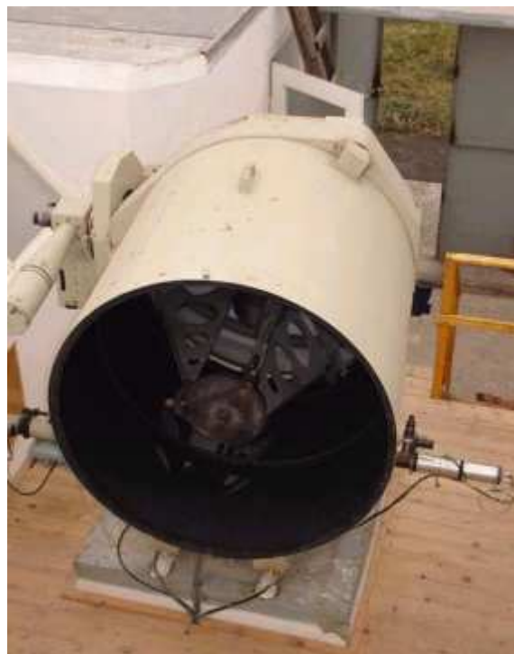
Рис.5. Телескоп ТПЛ-1М, D = 100 см. Используется для наблюдений далеких космических объектов.