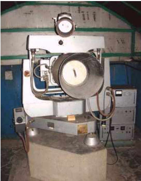
Рис.1. Специальная фотографическая камера для наблюдений низкоорбитальных ИСЗ АФУ-75. Все результаты наблюдений, использованные в международных программах, получены на этом приборе.

Выведенный на орбиту в 1957 году первый спутник Земли позволил существенно улучшить точность связи между различными системами геодезических координат. С этого момента положено начало становлению космических навигационных систем и развитию космической геодезии.