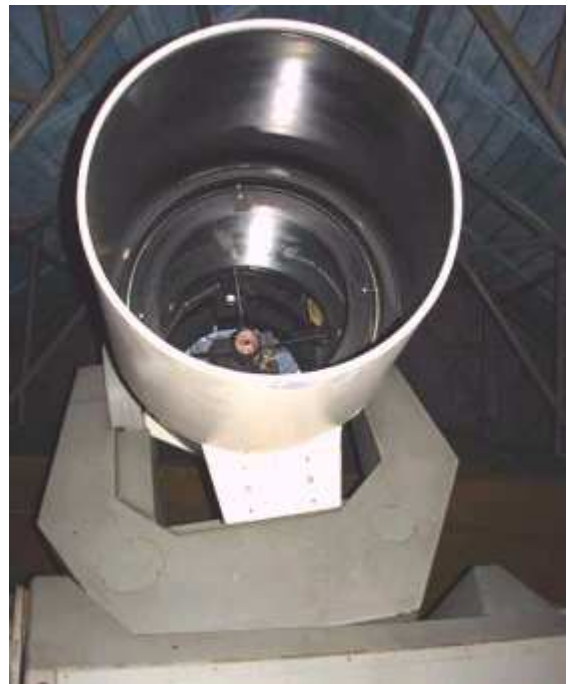
Рис.2. Немецкая фотографическая спутниковая камера SBG D = 42 см. Результаты наблюдений ГСС, вошедшие в каталог [2], получены на этом приборе.

местонахождения [1]. Проложив первыми в СССР на карте звездного неба трассу 1-го ИСЗ, сотрудники ЛКИ включились в реализацию Всемирной программы спутниковой триангуляции. Фотографические наблюдения специальных ИСЗ позволили определить положение станции в международных проектах “Стандартная Земля 1, 2, 3” с наивысшей в то время точностью \pm 6 м.