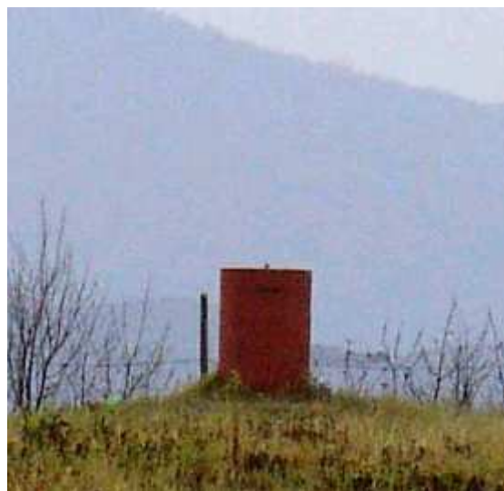
Рис.7. Геодезический знак нулевой точности в п. Деревка (UZHD)