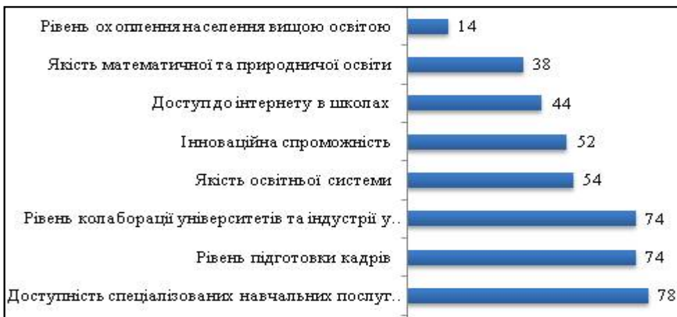
Рис. 2. Місце України в рейтингу глобальної конкурентоспроможності 2015-2016 рр. [11].

Варто зазначити, що роботодавці прагнуть залучати до роботи молодих фахівців, які можуть генерувати нові ідеї, швидко адаптуватися до змін і нововведень. Стандартні «пакети» освітніх програм ВНЗ вже не задовольняють нагальні потреби ринку праці. Неякісна вища освіта, яка залишається у по-