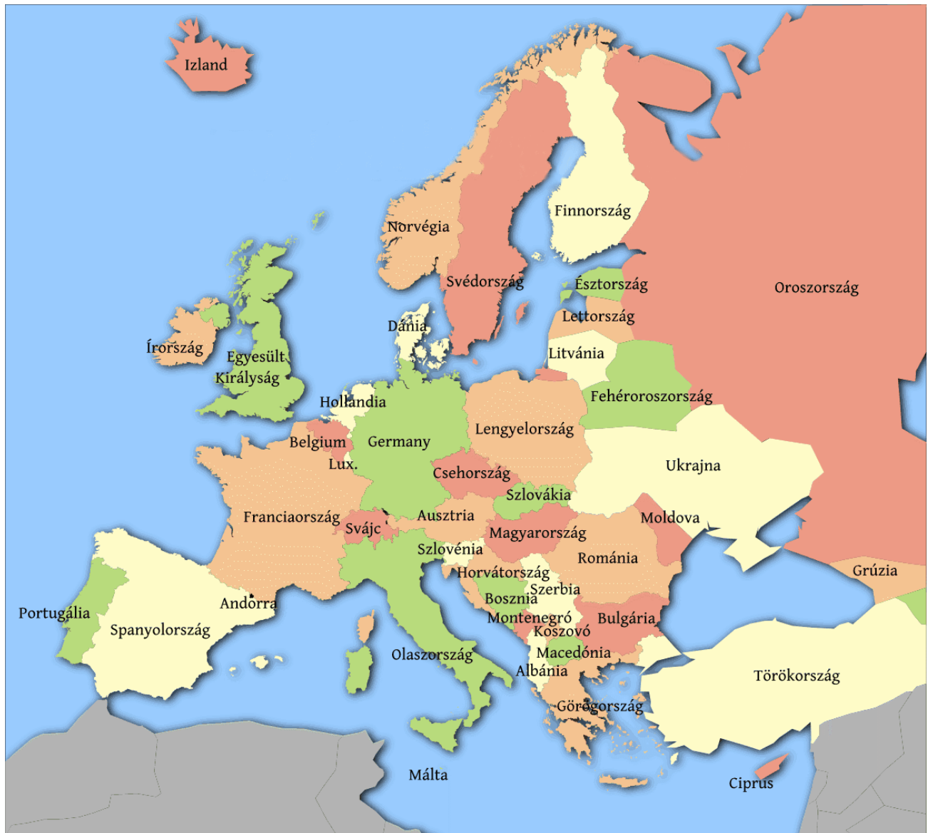
Európa politikai térképe