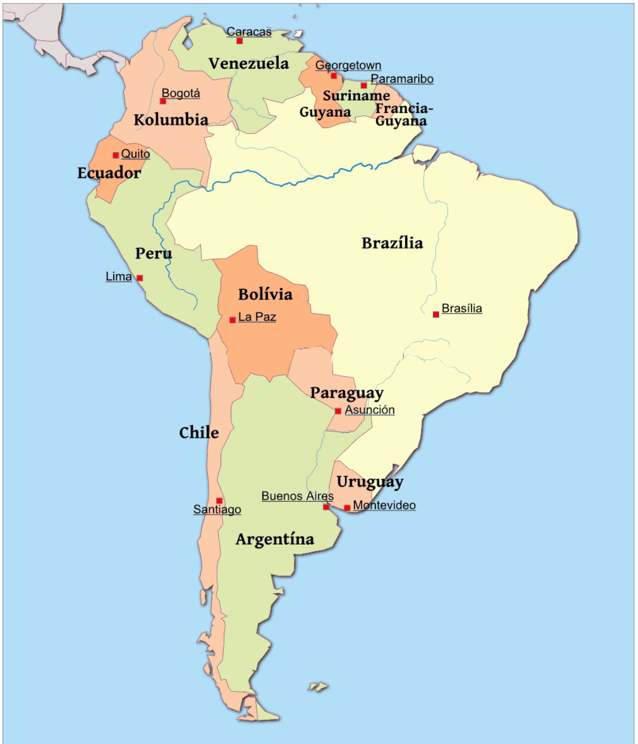
Dél-Amerika politikai térképe