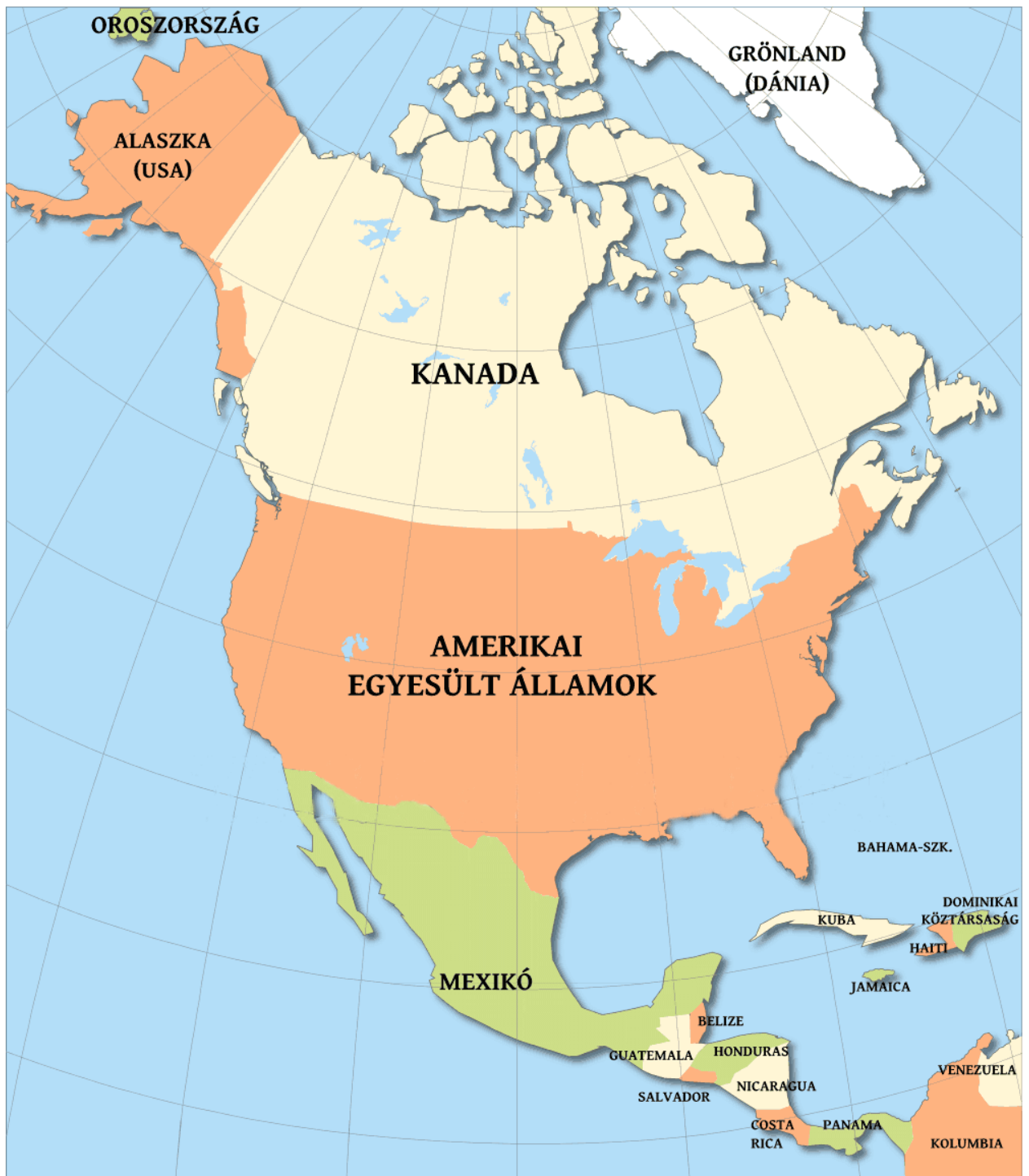
Észak-Amerika politikai térképe