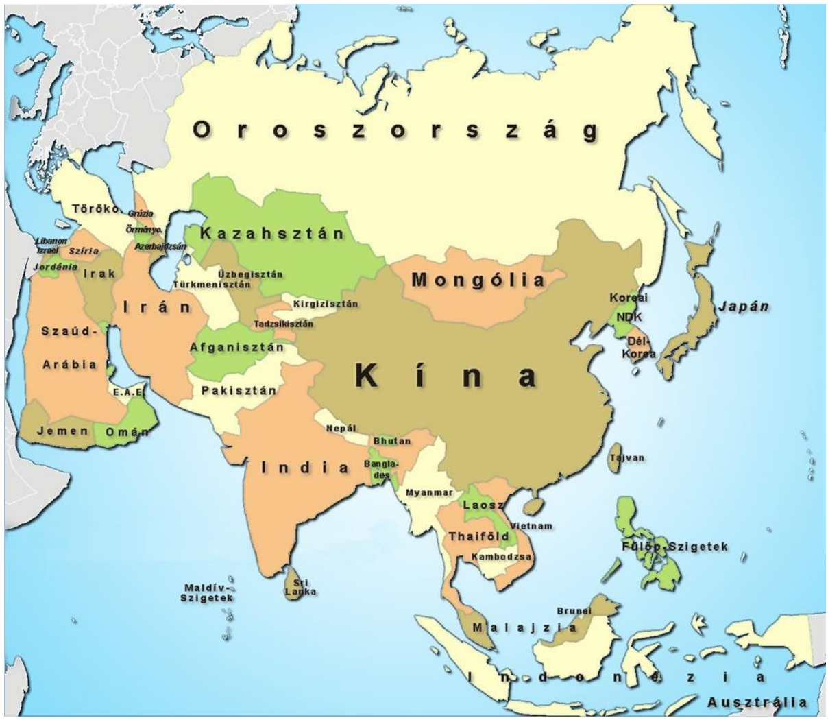
Ázsia politikai térképe