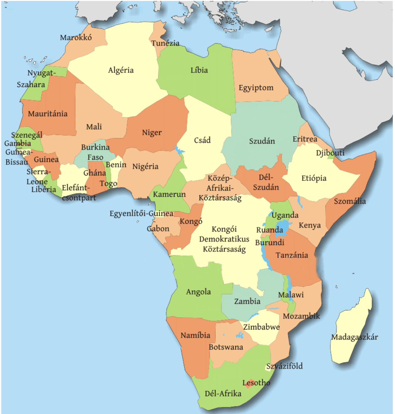
Afrika politikai térképe