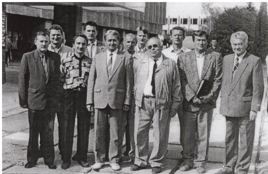
Колектив кафедри нової, новітньої історії та історіографії історичного факультету УжНУ. 2000 рік