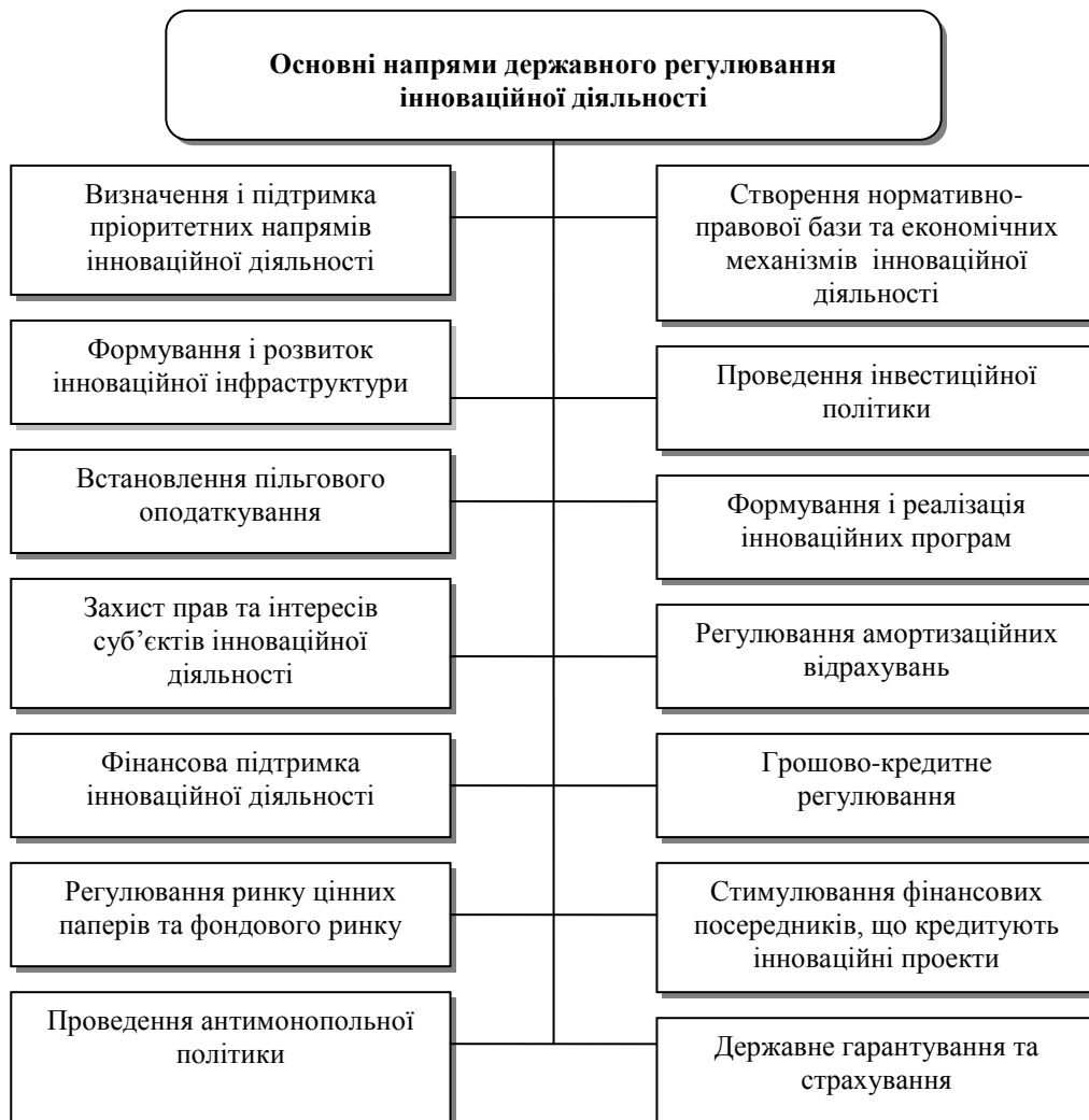
Рис. 2 Основні напрями державного регулювання інноваційної діяльності

Усю сукупність засобів, що застосовується державою з метою впливу на інноваційні процеси, можна поділити за кількома основними напрямками, які представлені на рис. 2.