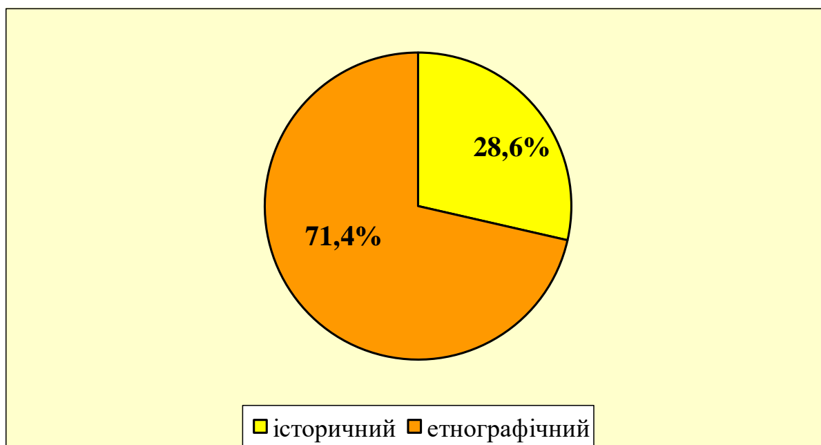
Рис. 2. Частка за профілем музеїв закладів професійно-технічної освіти Волинської області [2; 8; 11; 12; 13; 14; 16]

За профілями наявні музеї етнографічні – п'ять та історичні – два, що становлять 71,4 % та 28,6 % відповідно (рис.2). Музеїв інших профілів немає.