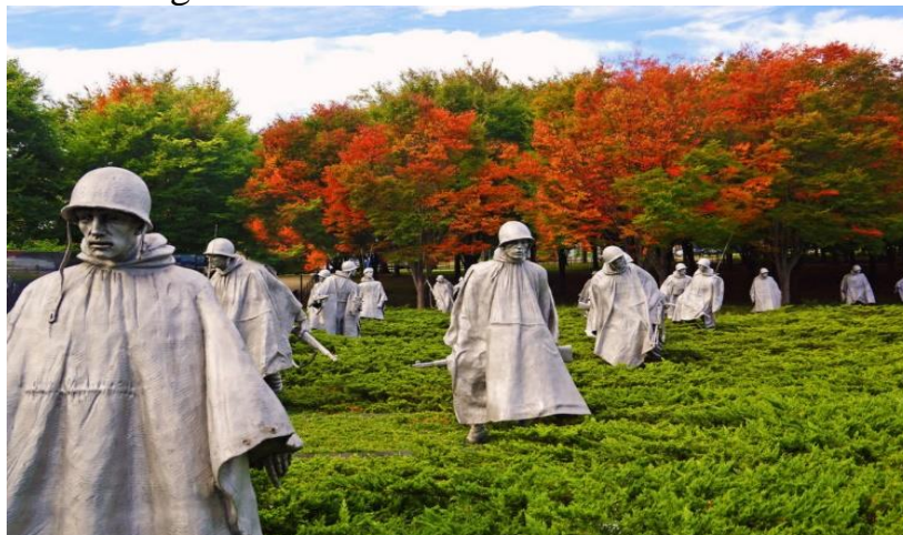
Fig. 1. Korean War Veterans Memorial, Washington, USA. ( https://susanintop.com/sight/memorial-veteranam-korejskoj-vojny )

The Korean War Veterans Memorial is a reminder of support for Korea in its struggle for freedom. It was a difficult experience for the US. The war lasted less than three years (1950-1953), but claimed as many lives as the Vietnam War. For the first time, UN troops took part in hostilities.