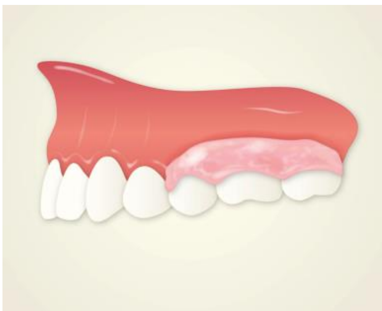
Рис.4. Схематичне зображення після накладання пародонтальної пов'язки