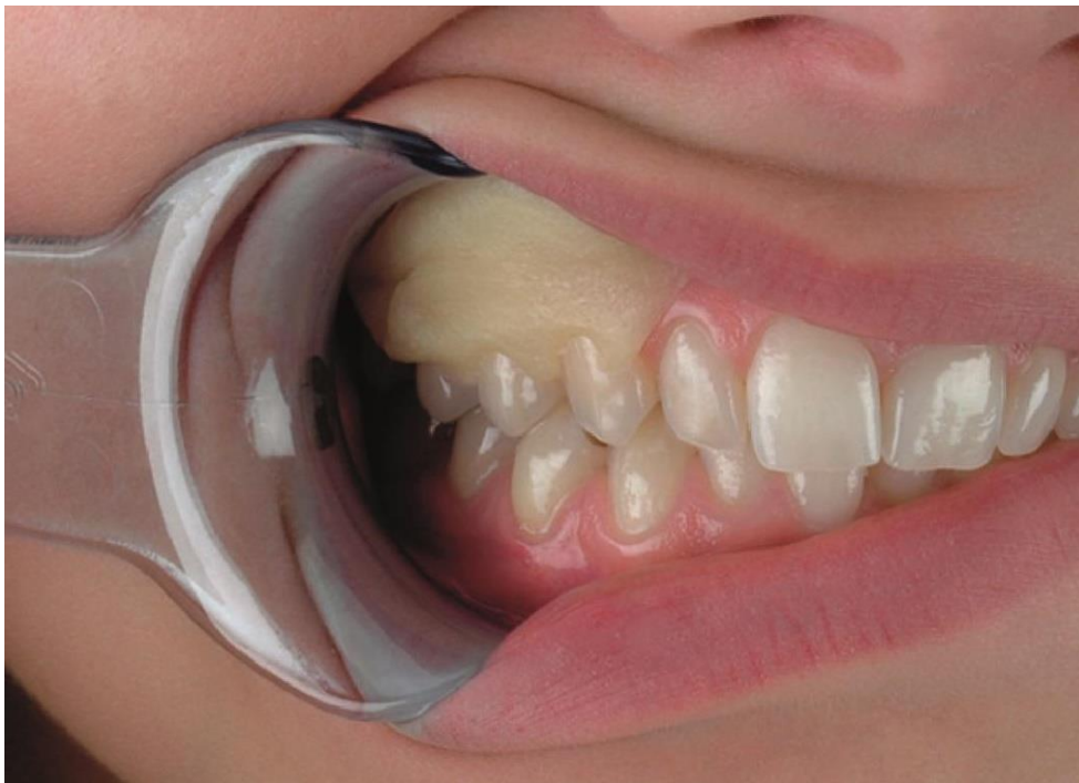
Рис.10. Вигляд пародонтальної пов'язки після накладання