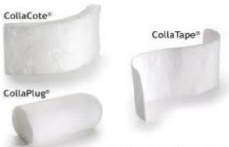
Рис.6. Різновиди колагенових пов'язок: CollaCote, CollaTape, ColaPlug