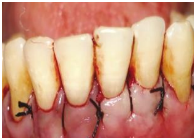
Рис.1. Вид після ушивання області втручання (за даними публікації Kumar та колег, 2019)