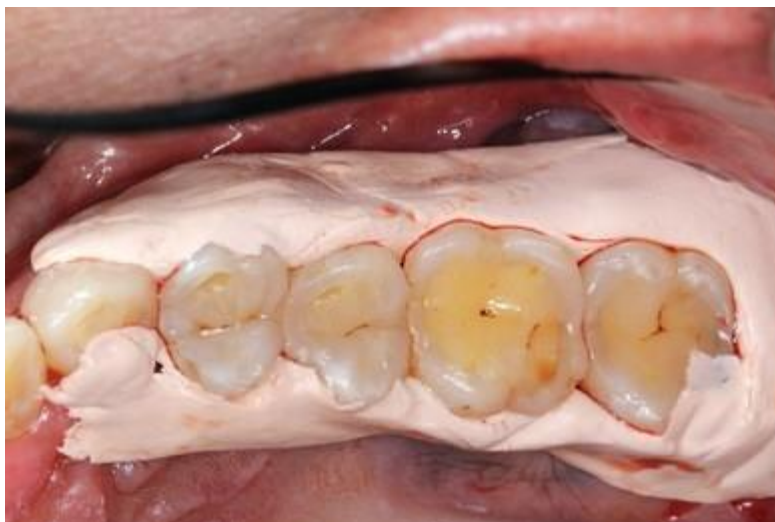
Рис.3. Клінічний вигляд після накладання пародонтальної пов'язки

Також пародонтальні пов'язки можуть використовуватися в якості носіїв антибактеріальних середників, на зразок хлоргексидину. Останній може бути включений в структуру пов'язок у формі гелю чи порошку. Інкorporація в структуру пов'язок антибіотиків та бактеріостатичних середників в окремих випадках може бути асоційовано із ризиком розвитку кандидозу. Однак у окремих випадках, як наприклад, після некротизуючо-виразкового гінгівіту пародонтальні пов'язки можуть бути ефективно використані як носії антибактеріальних середників. Для модифікації імунних реакцій в склад пародонтальних пов'язок можуть бути включені препарати на основі стероїдів. З метою досягнення обезболюючого ефекту у структуру пов'язок можуть бути також додані різні анальгетики, хоча ефективність таких є дискусійною. Також в пов'язки можуть бути додані похідні фенолу (як, наприклад, олія бергамоту), які сприяють загоєнню раневої поверхні.