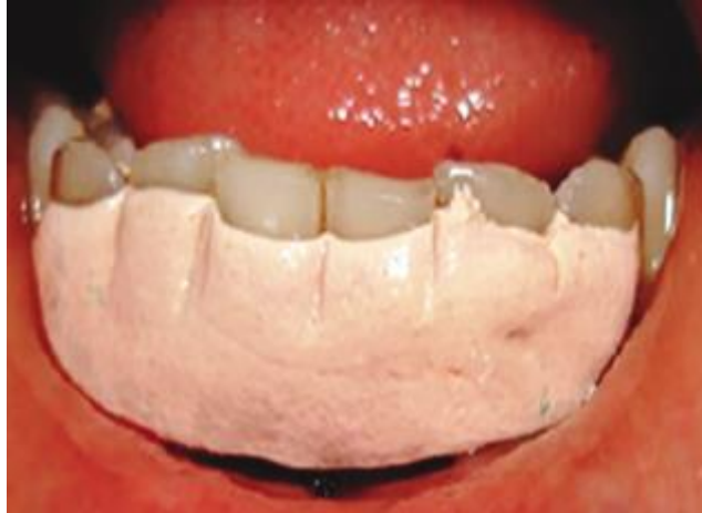
Рис.2. Вид після накладення пародонтальної пов'язки (за даними публікації Kumar та колег, 2019)