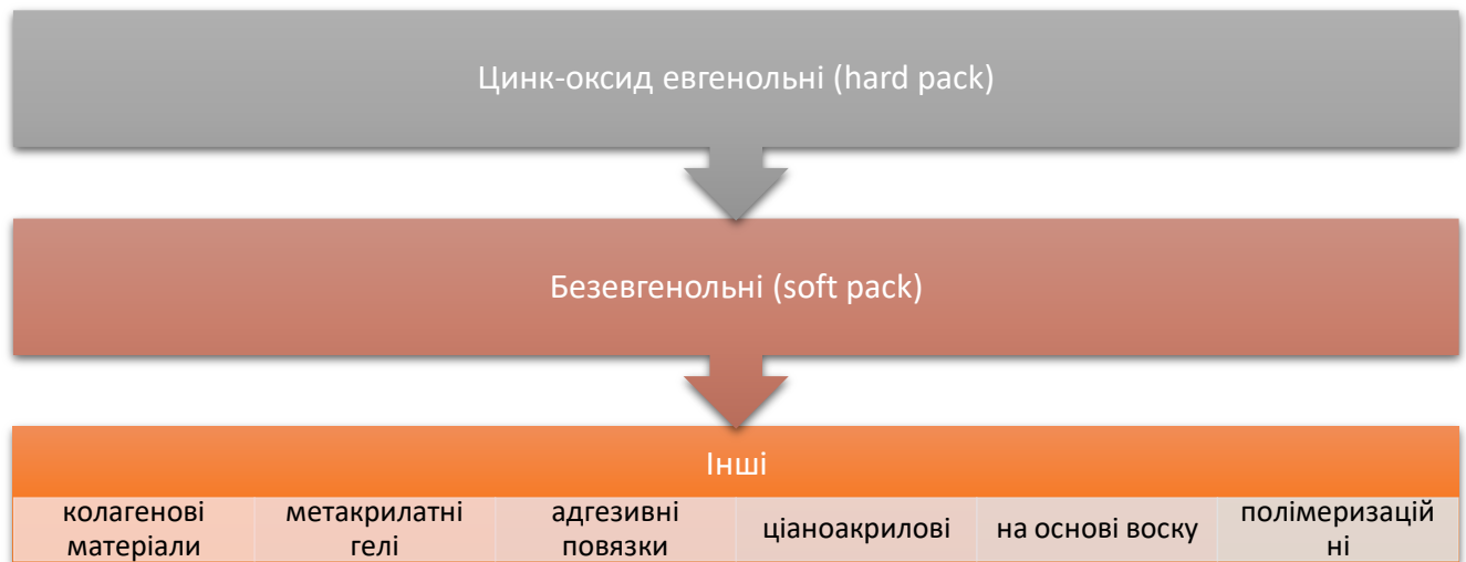
Рис.5. Класифікація пародонтальних пов'язок за Ward