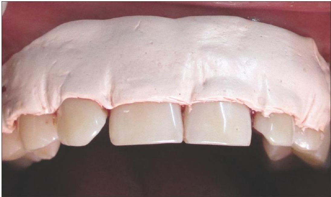
Рис.9. Вигляд пародонтальної пов'язки після накладання