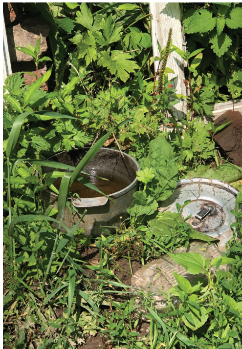
Казанок, в якому російські солдати готували собі їжу