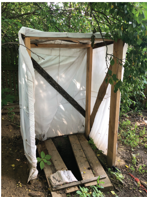
Облаштований окупантами на подвір'ї туалет