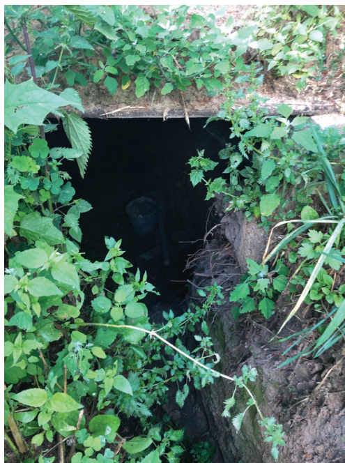
Вогнева точка росіян на городі респондентки («дота»)