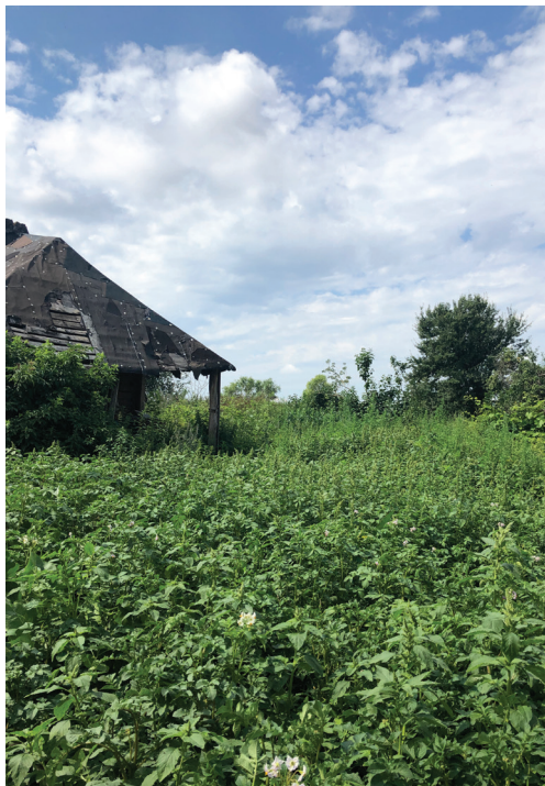
Хата респондентки у с. Полуботки