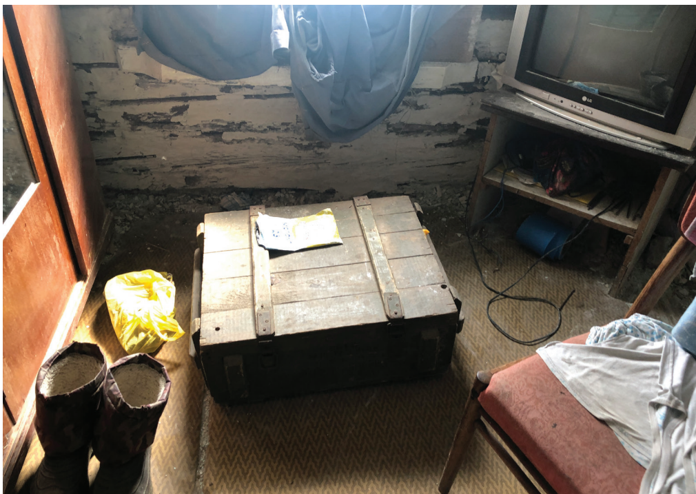
Снарядний ящик як новий елемент інтер'єру