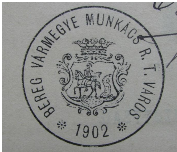
Рис. 9. Печатка м. Мукачева з 1902 р.