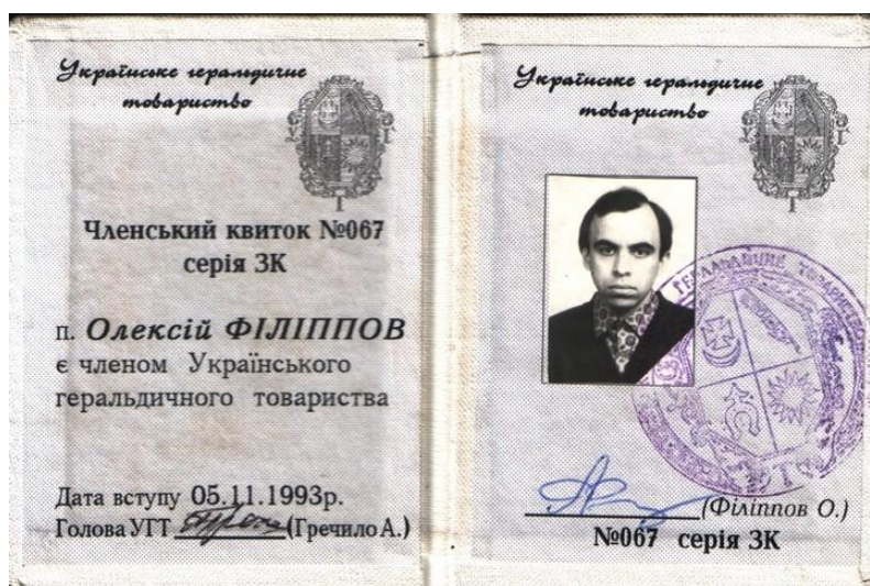
Рис. 2. Членський квиток О. Філіппова, члена УГТ.