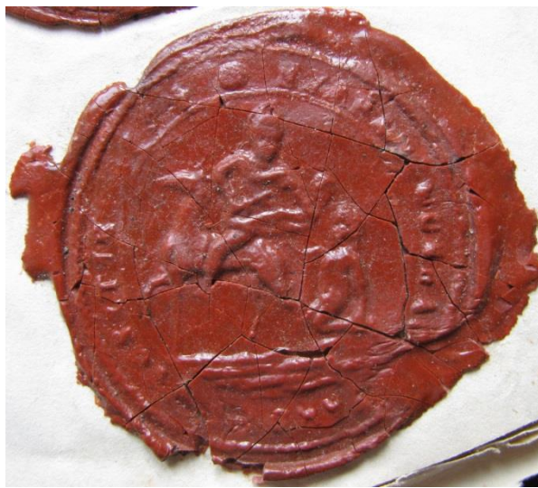
Рис. 8. Печатка м. Мукачева з 1844 р.