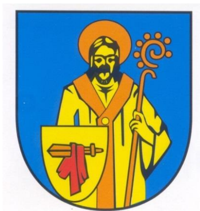
Рис. 5. Офіційний герб Мукачева з 1998 р.