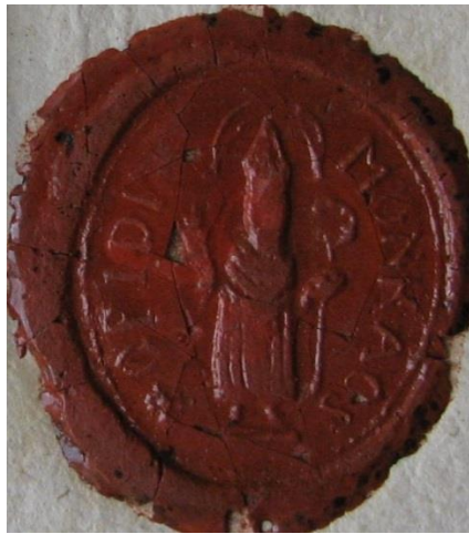
Рис. 7. Печатка м. Мукачева на документі 1816 р.