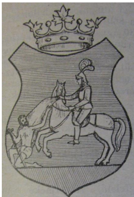
Рис. 4. Тинктура герба Мукачева 1903 р.