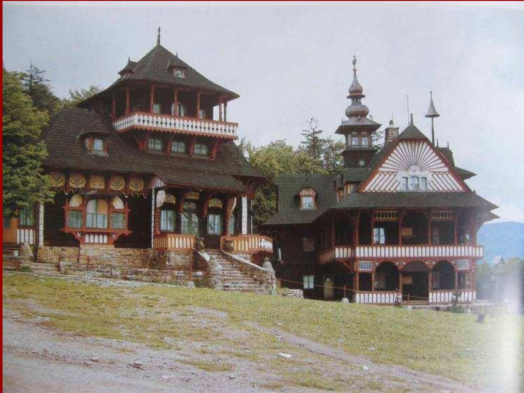
1. Dušan Jurkovič . Maměnka , 1896, Pustevně