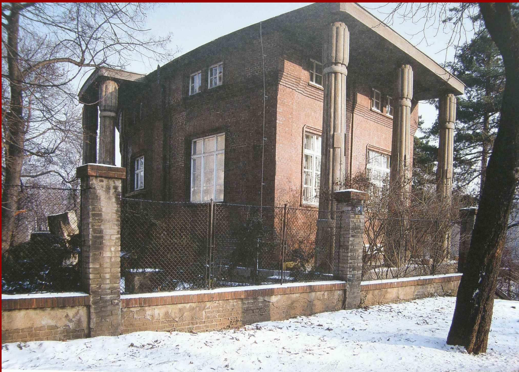
Die Bílek Villa