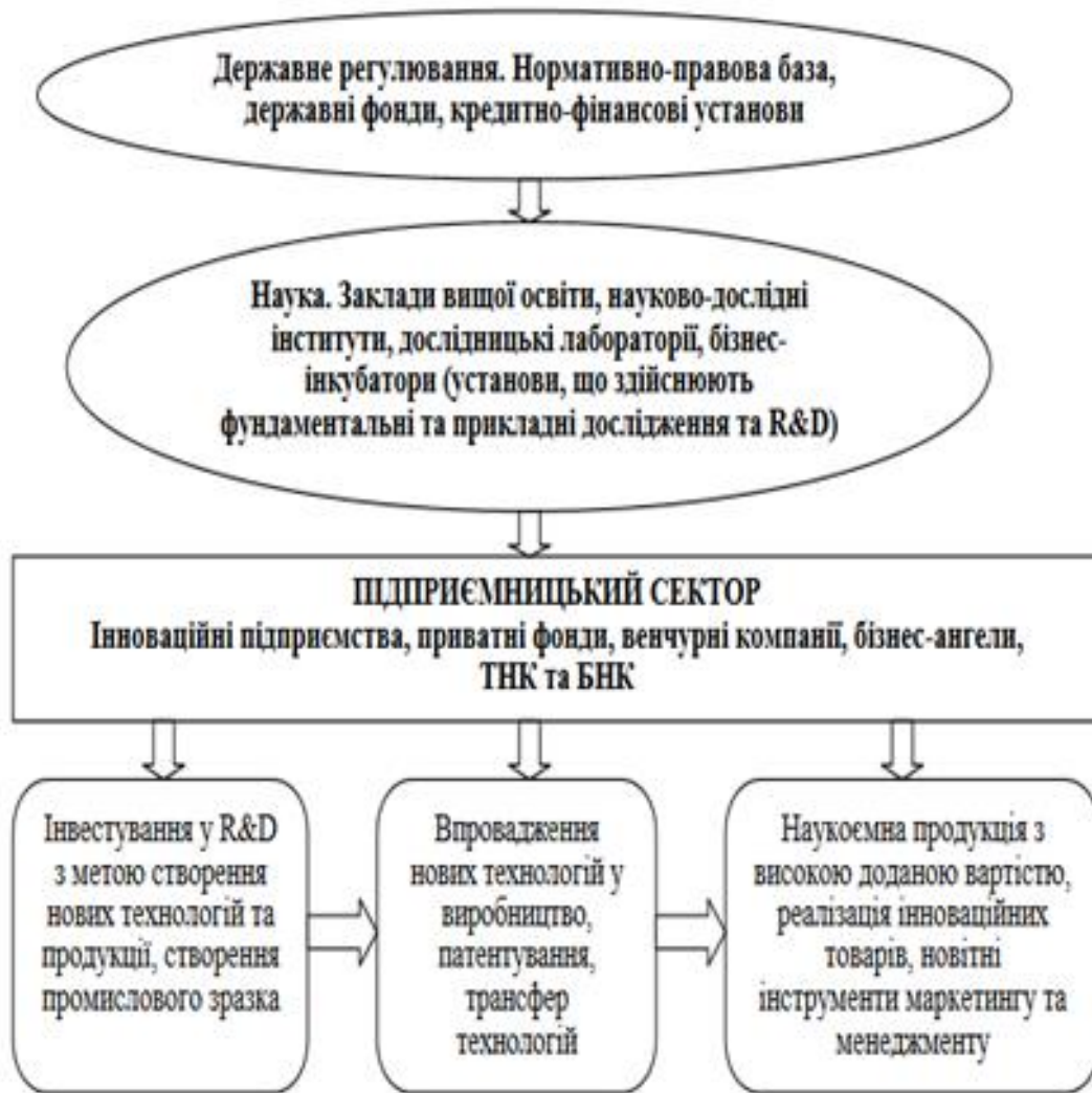
Рис. 1.5. Структурна схема національної інноваційної системи