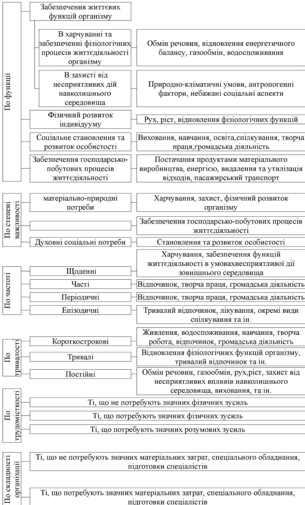
Рис.1 Містобудівна класифікація потреб населення (за М.М.Дьомінім)