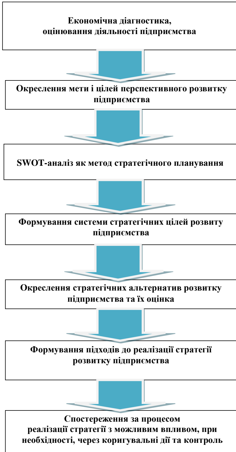
Рис. 3.1. Алгоритм побудови процесу забезпечення перспектив стратегічного розвитку лісомисливського господарства ДП „Довжанське ЛМГ”*

*Сформовано на основі джерела і доповнено автором: [37].