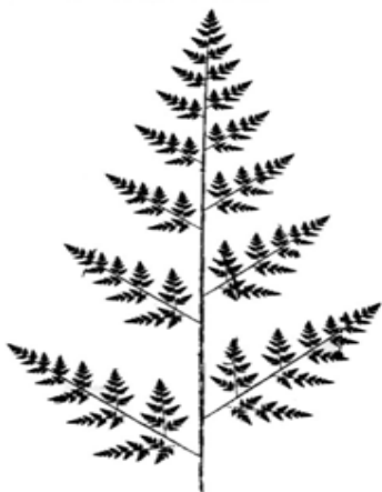
Рис. 1. Фрактал-папороть

Прикладом фрактальної структури, який найчастіше наводять науковці, є побудова листя папороті: кожен менший листок, розміщений на стеблі, майже точно відтворює будову великого листа; кожен із листочків, розташованих на цих менших листках, є майже тотожним і великому листу, і меншому листку, на якому розміщений він сам. На думку І. Набитовича [8], якщо вважати великий лист певною макроструктурою, то кожен листочок на стеблі і кожен листочок, розташований на цих листках, є підструктурою і структури наступного порядку, і великої макроструктури (рис. 1).