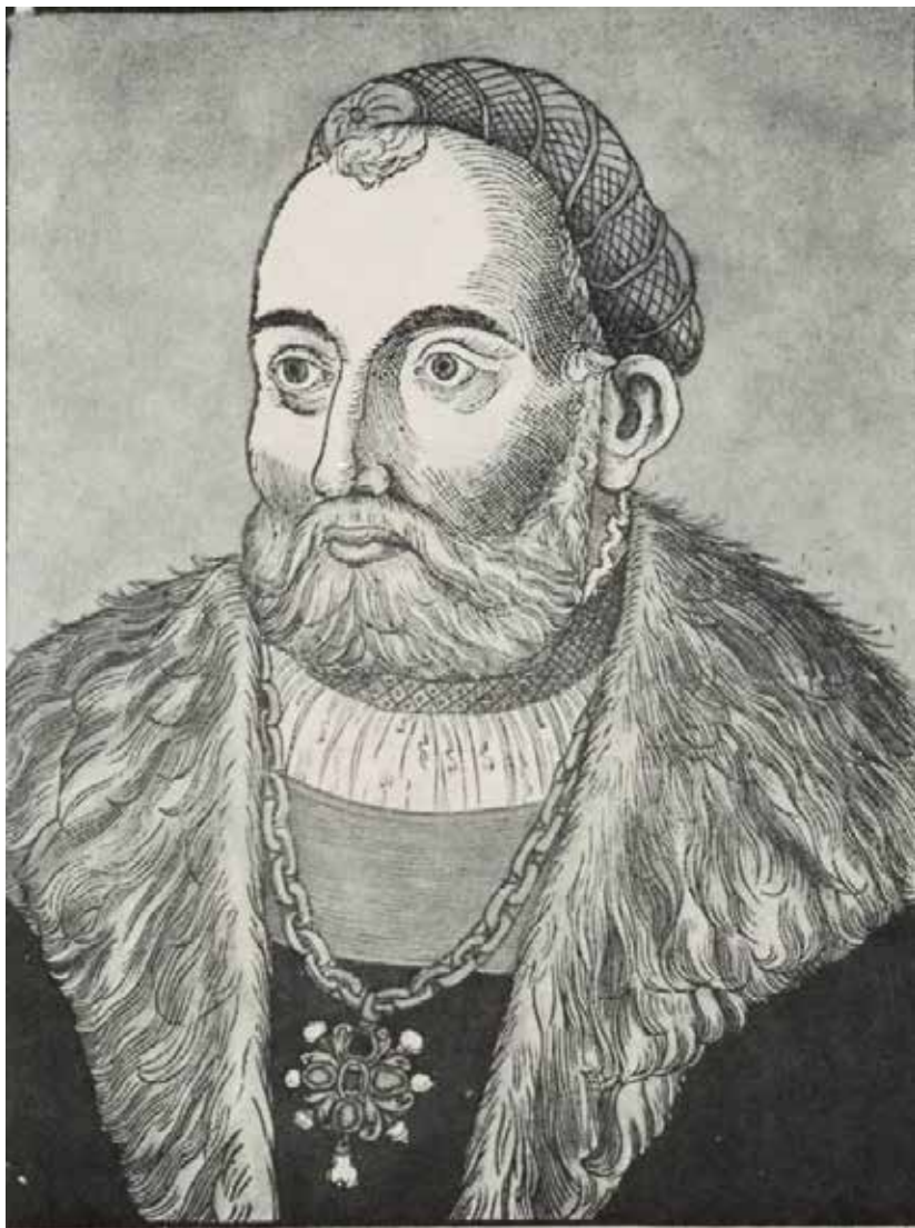
Ил. 4. Король Янош Запольяи. Портрет XVI в.

король Венгрии Янош Запольяи (ил. 4) через своего логофета (нотаря) обратился с «каким-то посланием о делах веры к протоигумену Афонской Горы Гавриилу» 5 . Ответ Гавриила был положен на хранение в королевскую ризницу, т. е. в личный архив короля. 6 Позже, в 1534 г., нотариь Лацко вторично писал на Афон и получил ответ. По словам архимандрита Василия (Пронина), с Афона пришел ответ в духе Православной Церкви. Можно допустить, что король пытался достигнуть мира между католиками, протестантами и православными в своей части государства, а поэтому консультировался с Афоном.