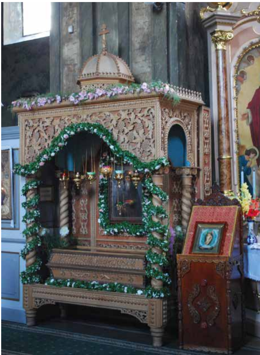
Ил. 3. Рака с частью мощей преп. Моисея Угурина в Мукачевском монастыре. Современная фотография.