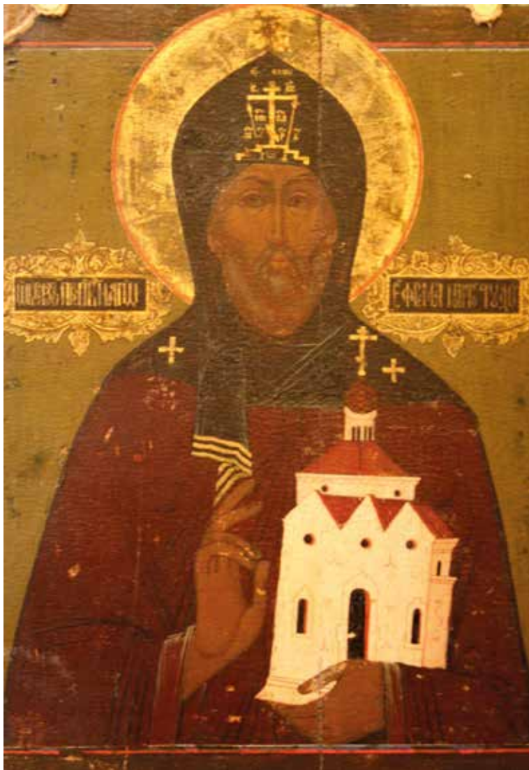
Ил. 1. Преп. Ефрем Новоторжский. Икона XIX в.

их, у которых Владимир мог взять священников, были Венгерские или Угорские Русские, которые жили и до настоящего времени живут по ту сторону Карпат в северо-восточной Венгрии и которые были обращены в православное христианство, как мы замечали выше, за целое столетие до нас» 3 . Князь Владимир пригласил в Киев троих братьев — Георгия, Ефрема (ил. 1) и Моисея Угринов 4 .