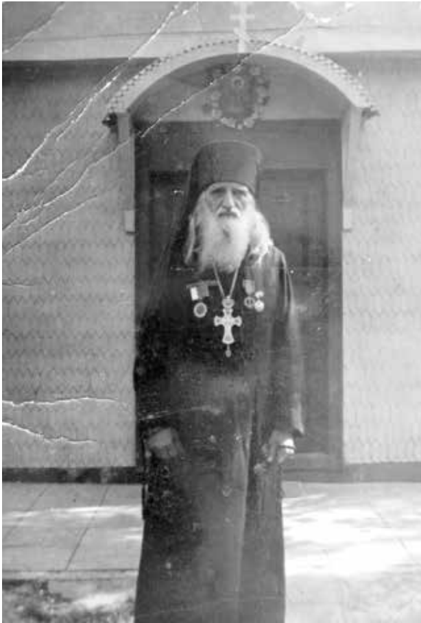
Ил. 9. Архимандрит Иов (Кундря). Фотография нач. 1980 х гг.

Отдельно следует упомянуть Свято-Троицкий мужской скит, который основал о. Иов (Кундря) в 1930 г. В монастыре свято хранят предание о том, что благословение на открытие скита дал преп. Силуан Афонский. О. Иов дважды предпринимал попытки попасть на Афон, но не мог получить документы. За попытку нелегально перейти границу он попал на 5 лет в советские лагеря, а потом воевал с нацистами на полях Второй мировой войны в составе Чехословацкого корпуса генерала Свободы. Праведная жизнь архим. Иова, Божий дар исцелять неизлечимые болезни сделали его святым еще при жизни. В 2008 г. УПЦ МП причислила его к лику месточтимых святых 42 . (ил. 9, 10).