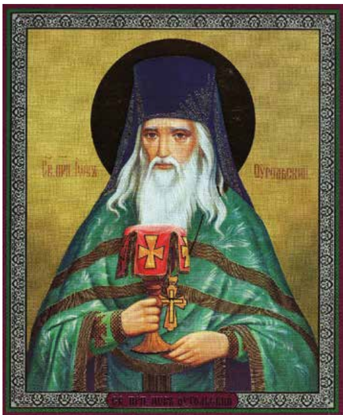
Ил. 10. Преподобный Иов Угольский. Икона 2008 г.

введены в научный оборот в приложениях к нашей работе об упомянутом монастыре. 43