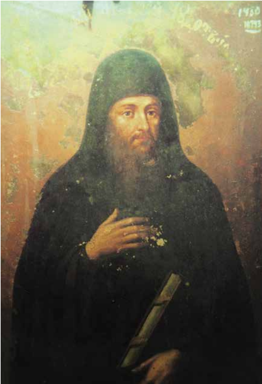
Ил. 2. Преп. Моисей Угрин. Икона XV в.

Согласно с «Киево-Печерским Патериком», черноризец с Афона в Польше постриг Моисея Угрина в монахи. Моисей был одним из первых насельников Печерской Лавры и соратником Антония (ил. 2). В Мукачевском Свято-Николаевском женском монастыре находится большая часть мощей (часть правой руки) преподобного. Мощи преп. Моисея в 1996 г. перенесли в Мукачевский монастырь, по благословению Блаженнейшего Владимира, Митрополита Киевского и всея Украины, ныне покойный архиепископ Му-