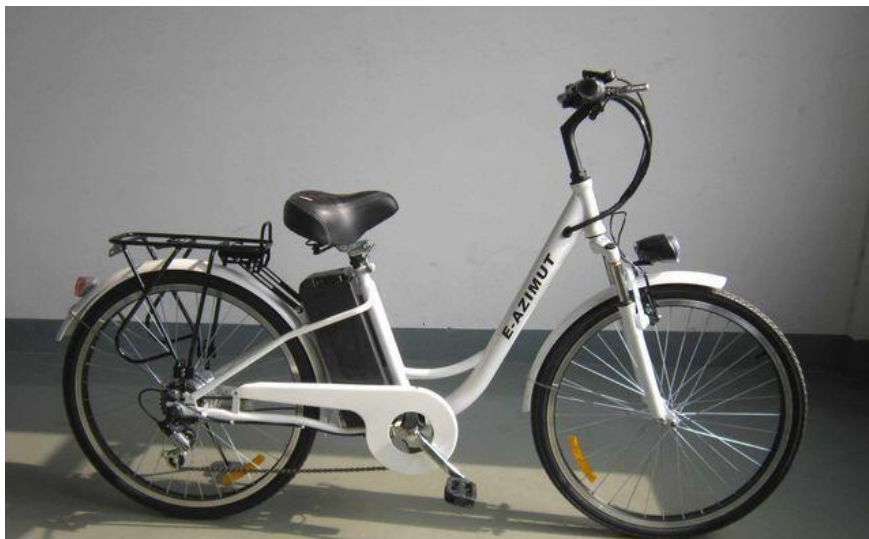
Рис. 2. Сучасний електровелосипед AZIMUT BREEZE – 1*

*Фото з сайту: http://mototehnik.com/p79198683-elektrovelosiped-azimut-breeze.html . Мототехніка. [5].