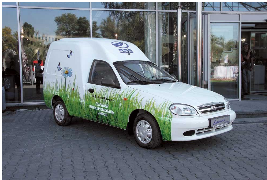
Рис. 6. Електромобіль українського виробництва ЗАЗ Lanos Пік-ап*

* Фото з сайту: http://www.autocentre.ua/