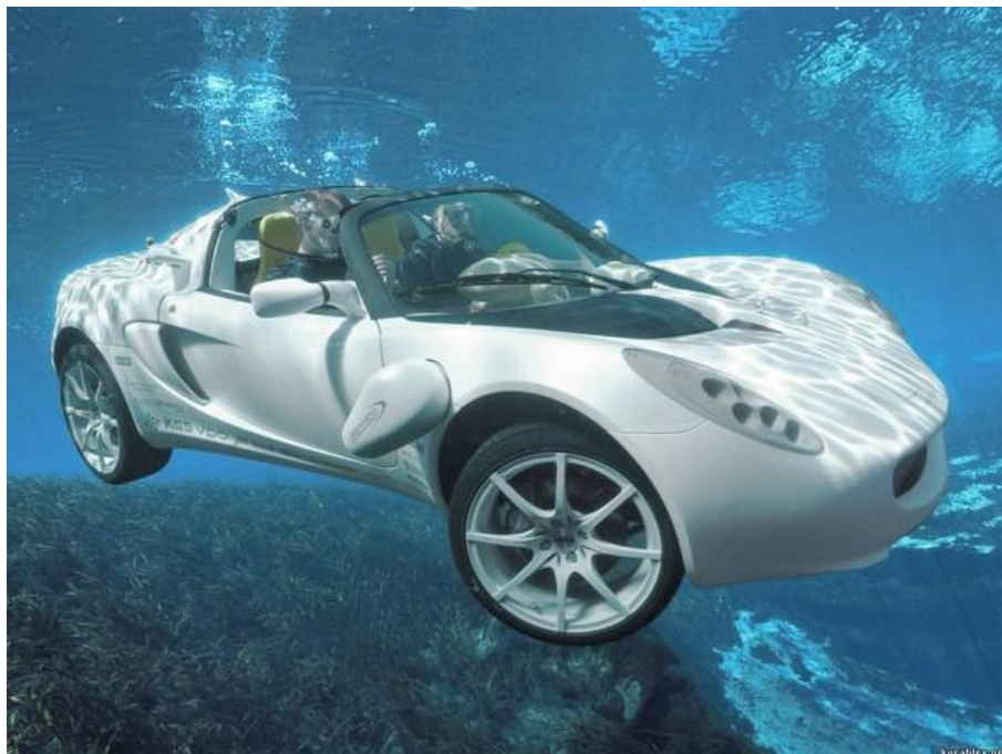
Рис.1. Підводний автомобіль «sQuba»*

масове виробництво і продаж споживачам пов'язані із низкою перешкод, пов'язаних із тими чи іншими соціально-економічними аспектами розвитку суспільства.