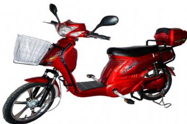
Рис. 3. Електроскутер AZIMUT FLH 001*

водію безпечно і комфортно пересуватися вулицями міських і сільських населених пунктів. Цей транспортний засіб, згідно з даними виробника, здатний комфортно перевозити масу в 130 кг (водія і пасажир). В цьому електроскутері використовуються кислотно-свинцеві акумулятори, недоліком яких є великі габарити і маса, довша тривалість зарядки та невелика циклічність зарядів. Вартість цього електроскутера станом на 1 вересня 2015 року в Інтернет-магазині «Мототехніка» становила 11 750 грн [5].