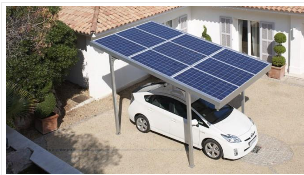
Рис.8. Сучасна домашня сонячна зарядна станція*

Позитивним моментом є й те, що за повідомленням ecosoft.in.ua , українська компанія Rentechno створює сучасні домашні сонячні зарядні станції для електромобілів, здатні конкурувати з аналогічними розробками американського виробництва, оскільки їх вартість у 5 разів нижча (рис.8).