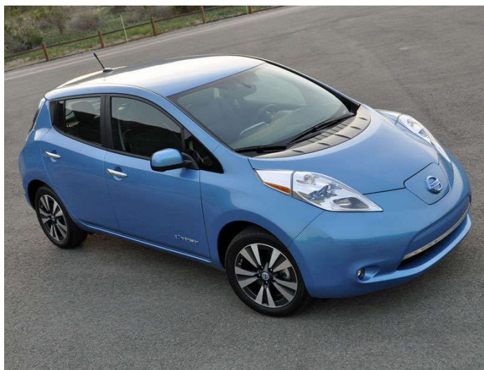
Рис. 4. Електромобіль Nissan Leaf *

Одним з найпопулярніших на сьогодні електромобілів в Україні та світі є Nissan Leaf від японського виробника, який визнаний автомобілем року в Європі (рис. 4).