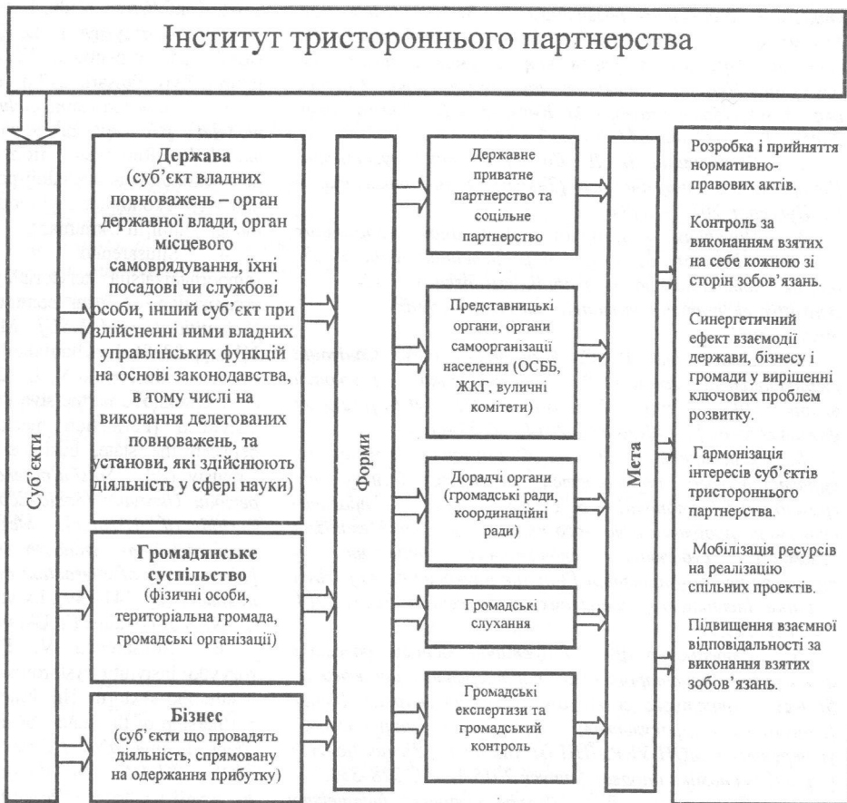
Рис. 1. Суб'єкти, форми та мета тристороннього партнерства

Тому партнерські відносини держави – бізнесу - «третього сектора» повинні будуватись на нормативно-правовій базі, яка б врегулювала прозорі відносини стосовно: права власності; судової системи; податкової системи та адміністрування податків; діяльності господарюючих суб'єктів монополістів та природних монополістів зокрема; бережливого використання надр; наповнення бюджетів усіх рівнів (сімейних, місцевих та державного). Результатом має стати громадянське суспільство, в якому норми, записані в нормативно-правових актах, будуть безумовно виконуватись та дотримуватись усіма суб'єктами тристоронніх