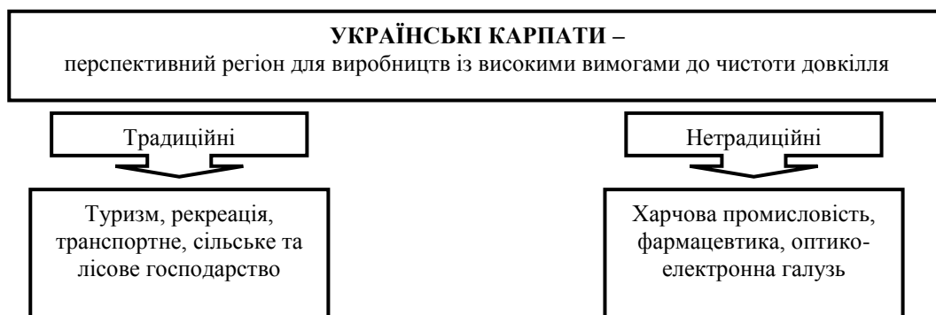
Рис. 1. Позиціонування Українських Карпат як перспективного регіону для виробництв із високими вимогами до чистоти довкілля

Розвиток нетрадиційних для гірських територій Українських Карпат виробництв повинен стати основою для виходу регіону з депресивного стану. Ці території слід представляти для потенційних внутрішніх і зовнішніх інвесторів як регіон, привабливий щодо розміщення виробництв із високими вимогами до чистоти довкілля (рис. 1).