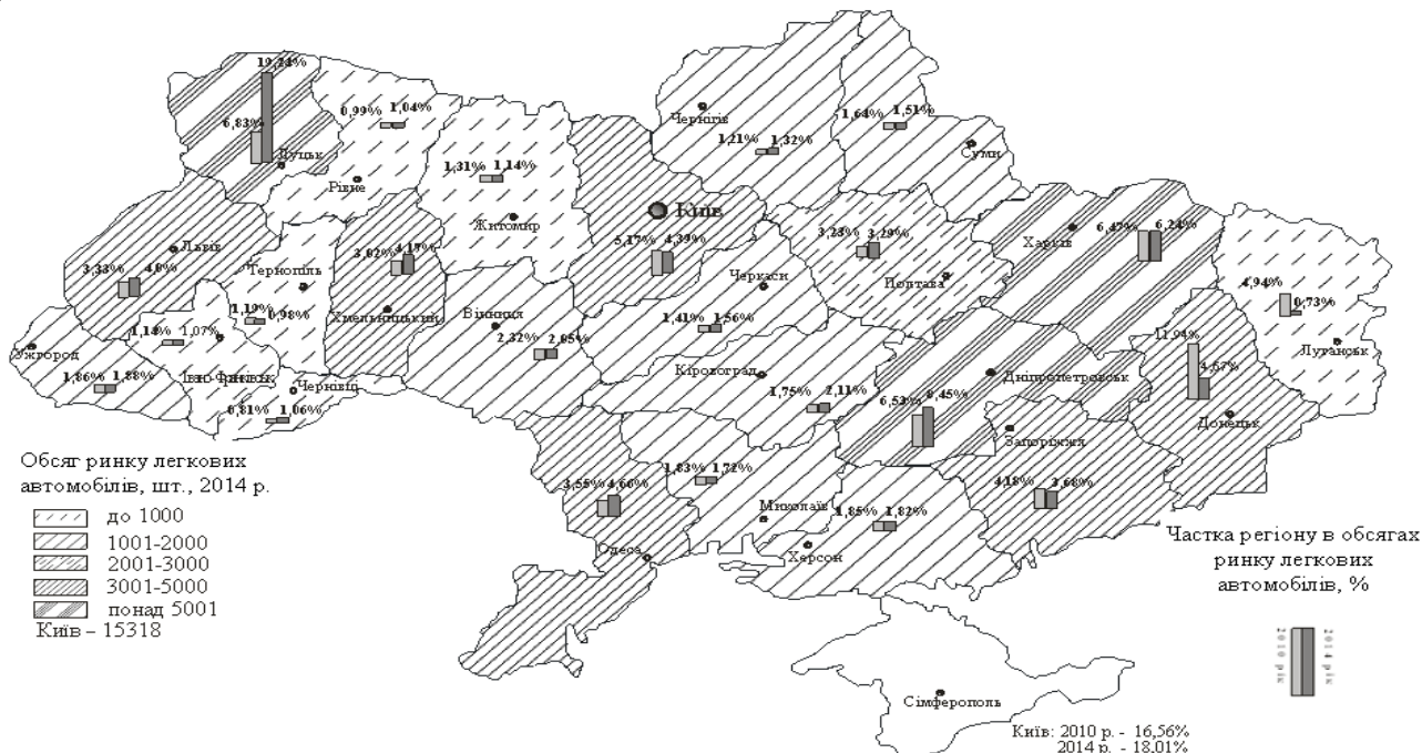
Рис. 2. Обсяги ринків легкових автомобілів (2014 р.), динаміка частки регіону в продажі легкових автомобілів (2010-2014 рр.) 1*

1 Без урахування тимчасово окупованої території Автономної Республіки Крим, м. Севастополя та частини зони проведення антитерористичної операції.