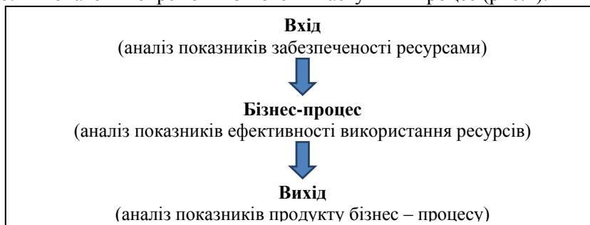
Рис.2.Етапи аналізу показників окремого бізнес-процесу*

процесу (потоків роботи) – це початковий вхід або ресурси процесу, до яких можна віднести матеріально-технічні, енергетичні, людські, інформаційні ресурси. Кінець процесу – це результат-продукт, з якого починається наступний процес (рис.2).