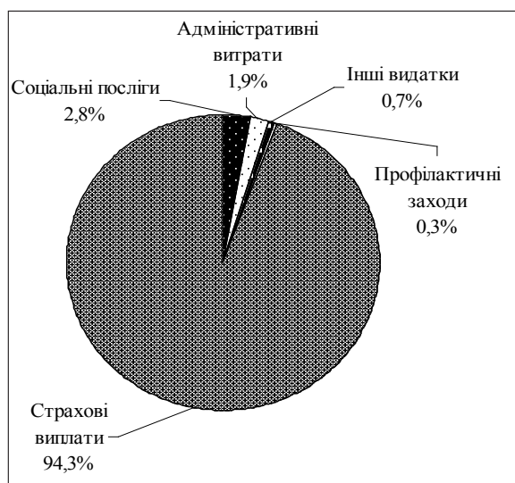
Рис. 1. Структура видатків державних фондів соціального страхування України, 2015 р.*

Доходна частина державних фондів соціального страхування в Україні формується переважно за рахунок соціальних відрахувань. Дослідження обсягів, складу та структури видатків фондів соціального страхування в Україні виявили, що близько 6% припадає на видатки, які за економічним змістом не можна вважати страховим (рис. 1), це профілактичні заходи, адміністративні та інші витрати.