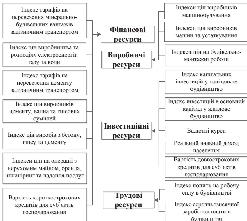
Рис. 2. Схема впливу факторів зовнішнього середовища на складові ресурсного потенціалу підприємств

свою чергою, складається з факторів непрямої дії і прямої дії (через контрагентів). Постає питання диференціації факторів на миттєві та інтервальні (за часом дії). Так, ціна будівельних матеріалів та енергоресурсів, обсяги попиту і пропозиції на будівельну продукцію, тарифи на вантажоперевезення, податкове навантаження на підприємство миттєво впливають на ресурсний потенціал будівельного підприємства.