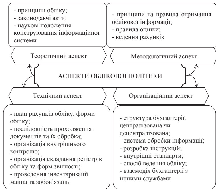
Рис. 1. Аспекти облікової політики

Поряд із зовнішніми та внутрішніми факторами, що впливають на формування облікової