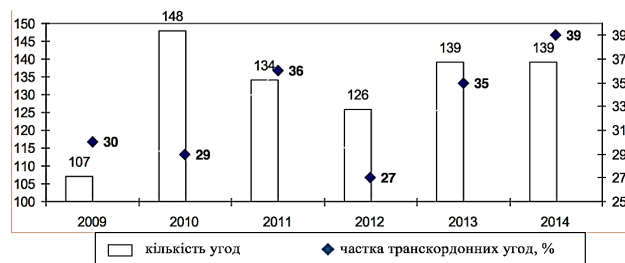
Рис. 1. Динаміка угод зі злиттів і поглинань в будівельній галузі ЄС у 2009–2014 рр.

У цілому основна ідея розвитку загального ринку послуг країн ЄС на сучасному етапі виражається у відмові від протекціонізму на внутрішньому ринку в комбінації зі зростанням активності в напрямі відкриття зарубіжних ринків для своїх компаній. Разом із тим у наявності тенденції консолідації ринку на основі трансграничних злиттів і поглинань, які протягом останніх років демонструють свою сталість (рис. 1) і в цілому, на думку автора, підкреслюють і сталість інтернаціоналізації будівельної галузі ЄС.