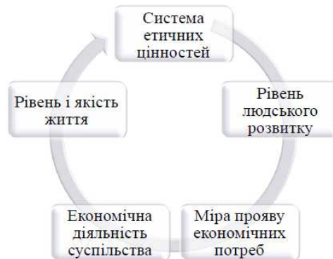
Рис. 1. Циклічність процесу формування національного добробуту

і розширеним. Просте відтворення характерне для умов сталого, розширене – для прогресивного розвитку економіки, а звужене – для економічної депресії (рис. 2). Тому система етичних цінностей має безумовний пріоритет як чинник покращання стану економічної системи, оскільки «у новому суспільстві роль людини незмірно зростає, вона стає і метою, і мірилом, і головним чинником прогресу» [26, с. 18].