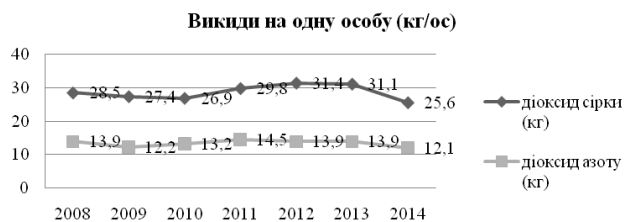
Рис. 1. Викиди діоксиду сірки та оксиду азоту на одну особу [2]

Важливою проблемою на даному етапі світового розвитку є забруднення атмосферного повітря викидами які потрапляють в атмосферу: пил, сірка, свинець, вуглець та інші речовини, небезпечні для людського організму. Вони несприятливо впливають на кругообіг багатьох компонентів на землі. Забруднюючі та отруйні речовини переносяться на великі відстані, потрапляють з опадами в ґрунт, поверхневі та підземні води, в океани, отруюють навколишнє середовище, негативно позначаються на прирості рослинної маси.