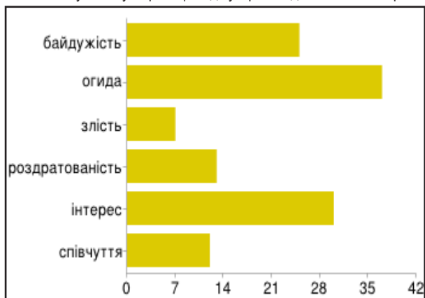
Діаграма 3 Яка у Вас була реакція від зустрічі з одностатєвою парою?

Позитивне ставлення до представників нетрадиційної орієнтації і одностатєвих пар пояснюють наступними причинами: