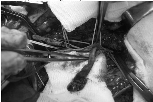
Рис. 2. Інтраопераційне фото хворой Р. Флотуючий тромб стегнової вени, що перейшов через тромбовану вену Джіакоміні на глибоку вену стегна.

лення флотуючого тромбу зі стегнової вени, лігування глибокої вени стегна та видалення МПВ та вени Джіакоміні (рис. 2).