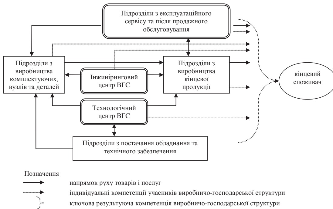
Рис. 2. Організація взаємодії підприємств, що входять до складу ВГС з машинобудування