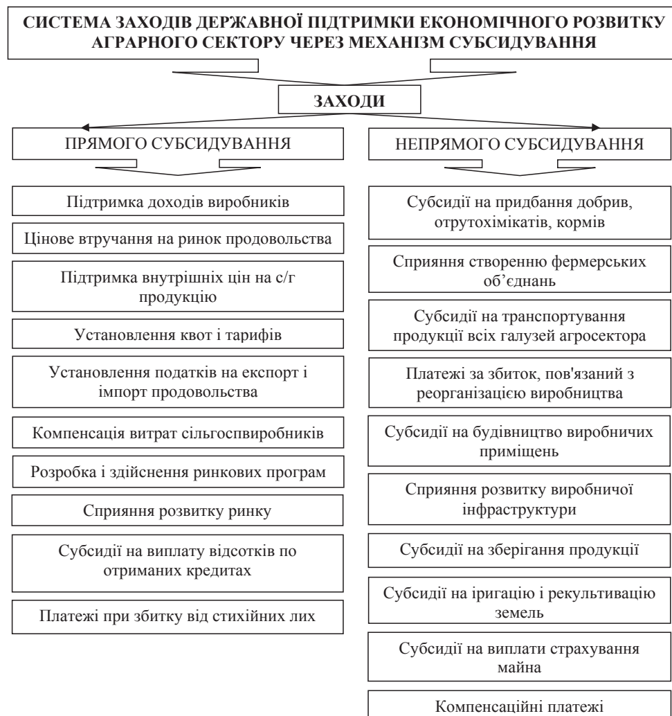
Рис. 1. Систематизація заходів державної підтримки аграрного сектора відповідно до досвіду зарубіжних країн через механізм субсидування

У досліджуваному контексті найбільший інтерес представляє досвід США щодо державного регулювання