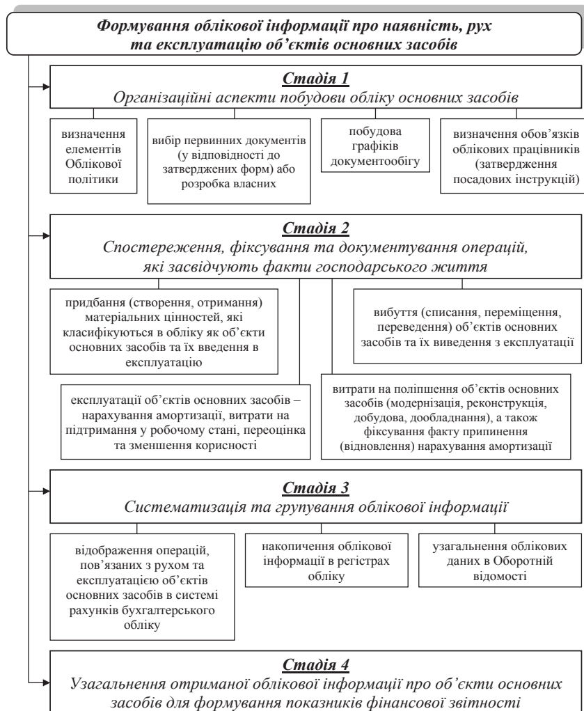
Рис. 2. Модель формування облікової інформації про наявність, рух та експлуатацію об'єктів основних засобів

Відображення фактів господарського життя пов'язаних з експлуатацією та рухом основних засобів забезпечується за допомогою ряду послідовних операцій із застосуванням відповідної техніки і методики ведення бухгалтерського обліку. Зазначеним операціям передують організація як об'єктивна необхідність функціонування будь-якого процесу, тобто його упорядкування в часі і просторі. Облік основних засобів як складова процесу бухгалтерського обліку, є логічною послідовністю стадій, які відбуваються у чітко визначеному порядку та не можуть відокремлюватися одна від одної. При цьому