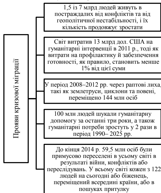
Рис. 1. Характерні особливості кризової міграції у 2008–2016 рр.

яка бере свій початок у системній асиметрії, або волатильності, які роблять певні групи мігрантів більш уразливими для переміщення. Концептуально кризова міграція має на увазі гострий тиск на людину або групи, а не обов'язково вказує на присутність екстремальної або раптової події. Проблемою концептуалізації кризової міграції як відповіді індивіда або спільноти на зовнішні події є те, що вона може приховати вже існуючі недоліки, акцентуючи увагу на фізичному виникненню, а не на цілісному оціненні соціально-економічних умов (див. рис. 1) [1].