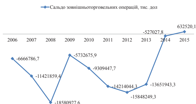
Рис. 1. Сальдо зовнішньоторговельних операцій за 2006–2015 рр., тис. дол. США [1]

важання імпорту над експортом в нашу державу (рис. 2) і про її здебільшого сировинну складову, а не готову продукцію, як це є у розвинутих країнах світу.