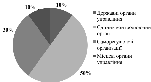
Рис. 3. Відсоткове співвідношення розподілу повноважень серед органів управління

Говорячи про відсоткове співвідношення участі державних та недержавних органів управління та регулювання біржової діяльності, доцільно було б надати більшу частину повноважень єдиному органу, що регулює, а іншу – розподілити між вищими державними органами управління, організаціями, які здатні до саморегулювання, та місцевими органами управління (див. рис. 3).