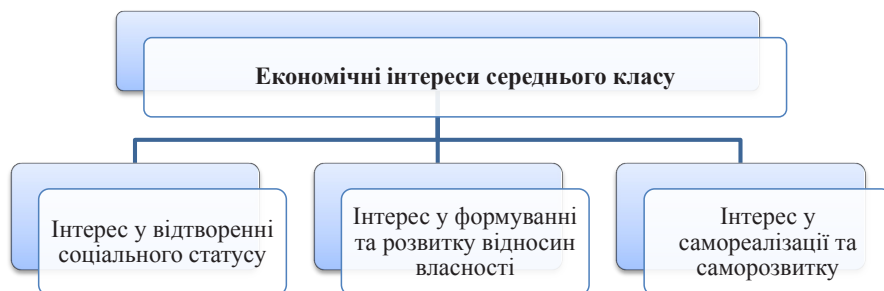
Рис. 2. Економічні інтереси середнього класу

Інтереси середнього класу подібні до інтересів більшості населення, проте їх специфіка полягає в тому, що середній клас потребує стабільного розвитку економіки та соціуму, оскільки йому є що втрачати. Прагнення до