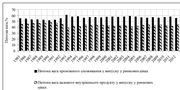
Рис. 2. Динаміка питомої ваги проміжного споживання та ВВП у випуску товарів і послуг в Україні у 1985–2012 рр.

висновок щодо динаміки часток проміжного споживання і ВВП, оскільки їх зміни мали порівняно стійкий характер.