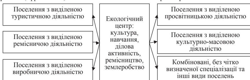
Рис. 1. Схема формування агроєкологічного поселення

Таким яскраво вираженим українським екологічним родовим поселенням є «Простір Любові», яке розташоване в Новоград-Волинському районі Житомирської області на мальовничих берегах річок Тетяни та Теньки,