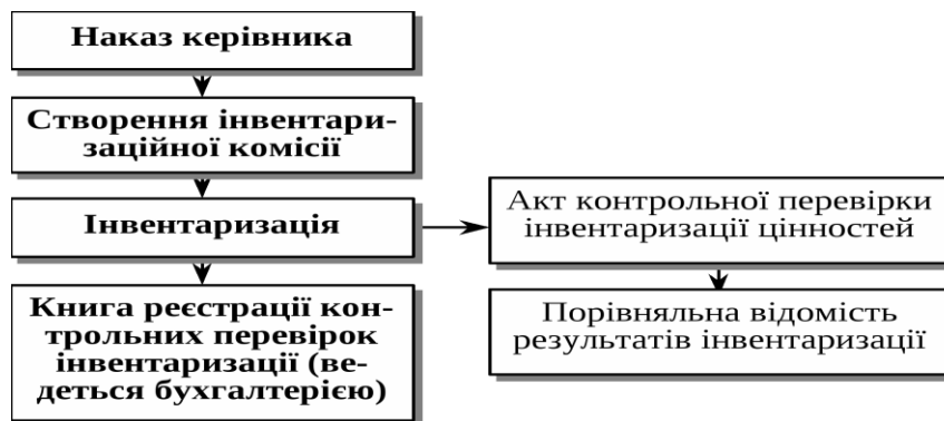
Рис. 1. Загальна схема проведення інвентаризації [5]

Основним нормативним документом являється Закон України «Про бухгалтерський облік та фінансову звітність в Україні». Для забезпечення достовірності даних бухгалтерського обліку та фінансової звітності підприємства зобов'язані проводити інвентаризацію активів і зобов'язань, під час якої перевіряються і документально підтверджуються їх наявність, стан і оцінка [1].