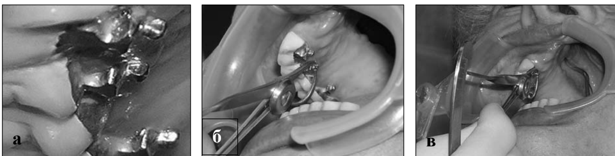
Рис. 3. Пацієнт П-няк, 67 років. а – стирання екваторів кульястих атачменів через 5,5 року експлуатації; б – вимірювання мікрометром діаметра кульки; в – медіальний кульястий шарнір стертий до 1,3 мм.

Вихід з цієї ситуації ми знайшли у тому, що матриця була активована за допомогою самотверднучої пластмаси. Вона пакувалась між металевим ложем для неї та самою матрицею, тим самим матриця ставала більш тугою.