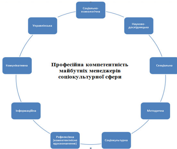
Рис. 1. Модель професійної компетентності майбутніх менеджерів СКС

Розкриємо зміст перерахованих вище компонентів, які найбільш повно відбивають елементи професійної компетентності майбутніх менеджерів СКС. Професійна компетентність – володіння постановкою цілей і завдань, принципами вибору змісту, знання дидактичних методів, прийомів, технологій, уміння не тільки передати певну суму інтегративних знань щодо форм організації і засобів навчання, але й забезпечити надійне їх розуміння і засвоєння, створення ситуації успіху майбутнього професіонала – менеджера СКС у процесі модернізації вищої освіти. Соціокультурна компетентність – володіння знаннями й уміннями в сфері менеджменту СКС, володіння методами соціокультурної діагностики, здатність розуміти індивідуальні особливості студентів, уміння зацікавити навчанням і розвинути стійкий інтерес до спеціальності, вміння будувати взаємини зі студентами, колегами, керівництвом, міжособистісні відносини в студентській групі й розуміння індивідуальних психологічних особливостей та емоційних станів; домінування соціокультурних норм спілкування, взаємодії і діяльності на гуманістичних основах у середовищі навчально-виховного і виробничого простору.