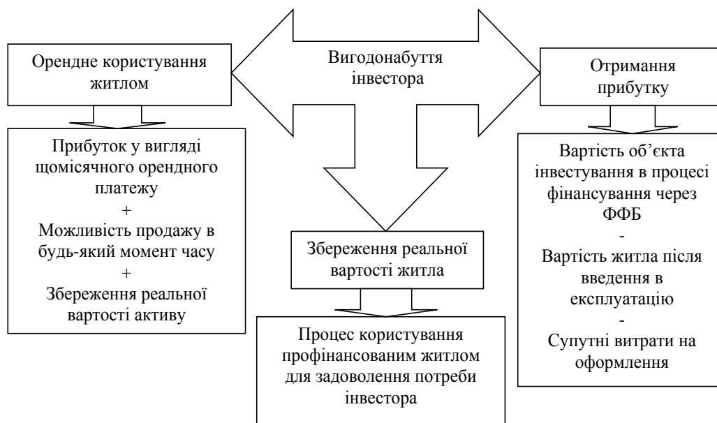
Рис. 2. Процес вигодонабуття інвестором за витратною складовою вибору об'єкта інвестування

Нині грошове знецінення є актуальним питанням українських інвесторів всіх галузей. Згідно з даними Держкомстатистики, що представляє Міністерство фінансів України, лише за останні три роки національна валюта знецінилась на 23% [12].