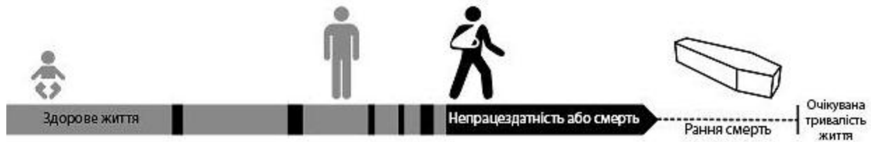
Рис. 1. Індекс DALY

YLD - кількість років, втрачених через непрацездатність