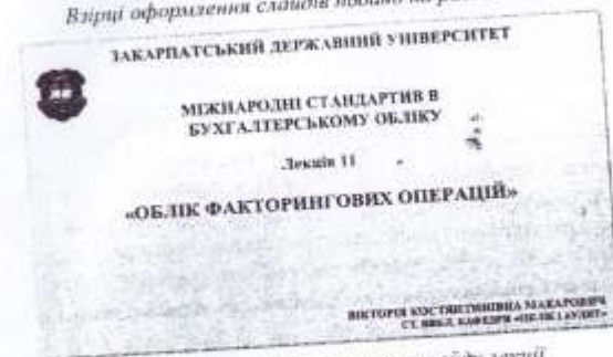
Рис. 2 Оформлення заголовку слайду лекції

Взірці оформлення слайдів подано на рис. 2 та 3.