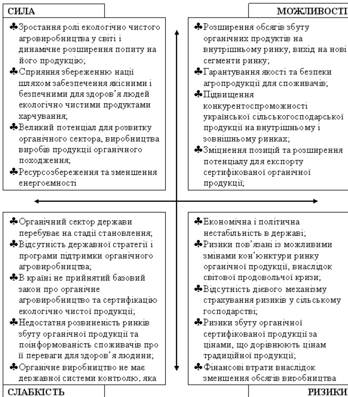
Рис. 1 Матриця SWOT – аналізу формування органічного агровиробництва у контексті екологізації сільського господарства України

Великий органічний агропродовольчий ринок відкривається у Німеччині, яка поставила за мету в найближчі 10 років збільшити частку виробництва екологічно чистих продуктів харчування з 3,3 до 20%, що буде відповідати обороту в 25 млрд. євро [4, с. 3]. На сьогодні населення Німеччини щорічно споживає різних органічних продуктів на загальну суму 2,6 млрд. дол. США при цьому у 2008 р. імпорт сировинних органічних продуктів становив 38% від загального обсягу, що споживалися в цій країні.