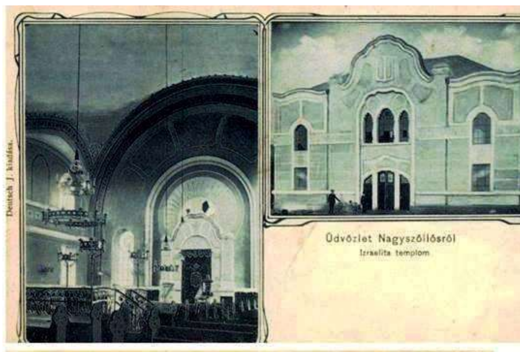
Рис. 3. Севлюська синагога