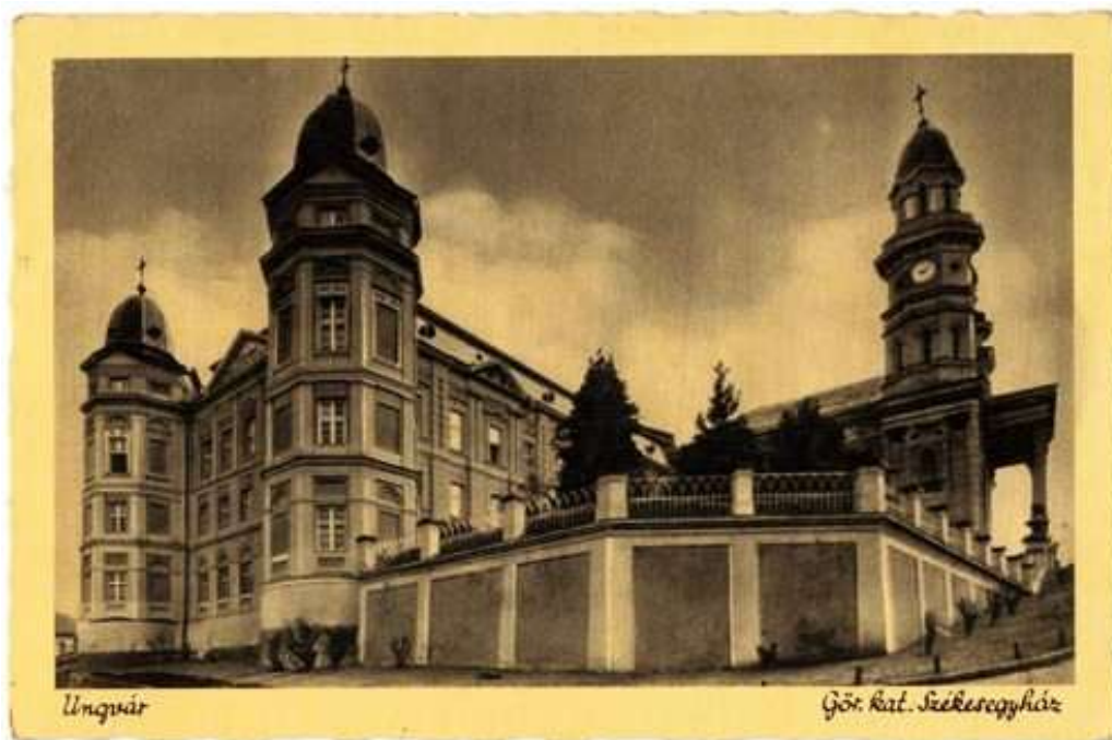
Рис. 2. Кафедральний собор в Ужгороді

Ще одним архітектурним символом міста є Кафедральний собор, розташований на нинішній вулиці Капітульній. У XVII ст. на цьому місці стояла хатка дяка Григорія та інші будівлі. Коли Іван Другет запросив у місто зі Словаччини єзуїтів (1640 р.), він виселив із цієї ділянки міщан і почав будівництво. Закладка Кафедрального Христо-Воздвиженського собору відбулася ще 1640 р., проте сучасний вигляд він отримав у 1876-1877 рр. після перебудови, яка виконувалася за рахунок коштів, наданих Релігійним фондом [6, с. 403] (рис. 2).